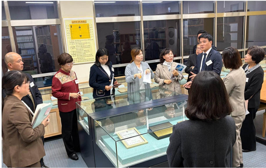
貴重資料の保存室を見学