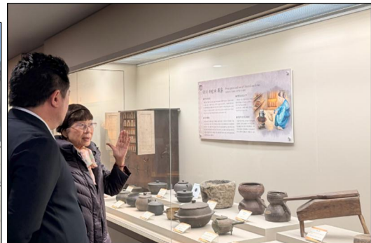
上：韓薬を煎じる道具を見学