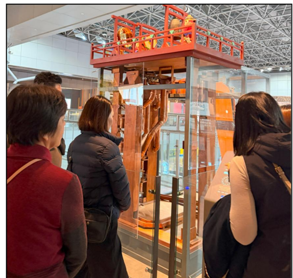
右下：自動水時計の仕組みが分かる模型