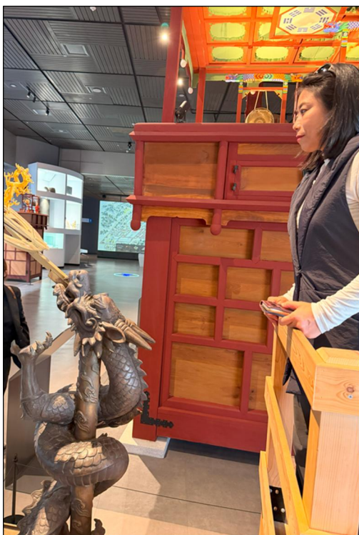
左：朝鮮時代の自動水時計の復元模型

・朝鮮王朝時代の宮殿内デジタルマップから、展示下部のアイコン（気象観測道具など）を探す展示。