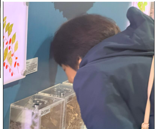
下：生薬を嗅いでいるところ