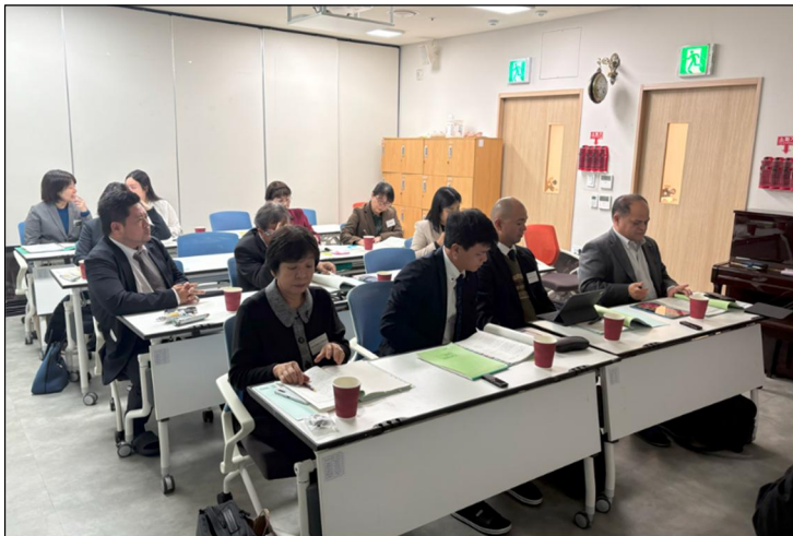
【視察調査の様子】 ナレ希望学校の教室でもある。