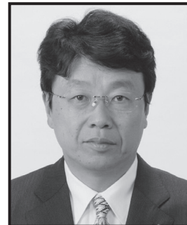
きたむらはるお 日本保守党 法律顧問 弁護士