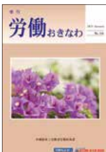
労働政策課広報誌 「労働おきなわ」