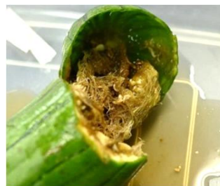
加害されたヘチマ