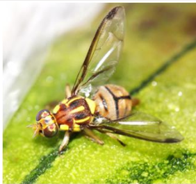
セグロウリミバエ成虫