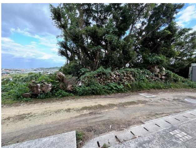
E 剪定枝 (※詳細及び他箇所は現場確認すること)