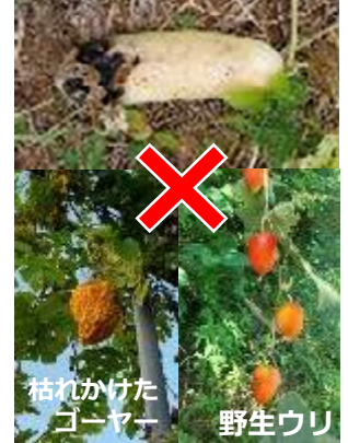
枯れかけた ゴーヤー