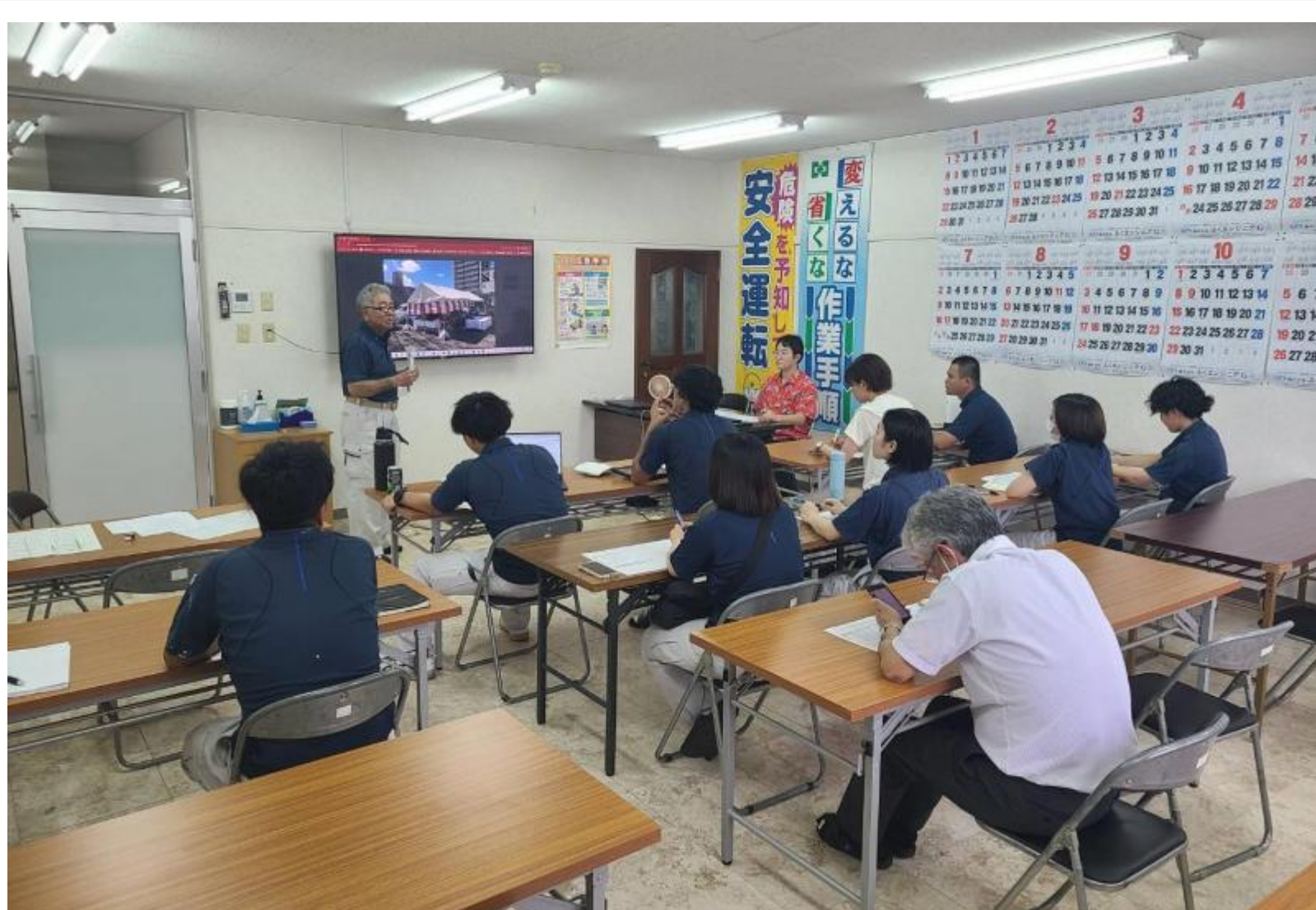
技術伝承塾の様子

ベテラン社員と若手社員ペアによる現場での技術・技能伝承 現場業務に関するベテラン社員の蓄積した経験談を座学で学ぶ技術伝承塾 短時間勤務や休暇を取りやすい体制づくり 高齢職員に任せる作業内容を負担なくできるように考慮 所定外労働の分析による業務プロセスの改善システム等を活用した作業の簡素化・効率化