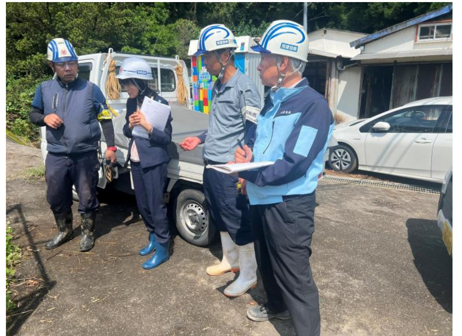
工事現場の社内検査対応をする社員（73歳） 写真右端

また、高齢者だけでなく、誰もが安心して働き続けられる環境整備として、社員の健康管理とワークライフバランスを重視した働き方改革などにも取り組んでおります。