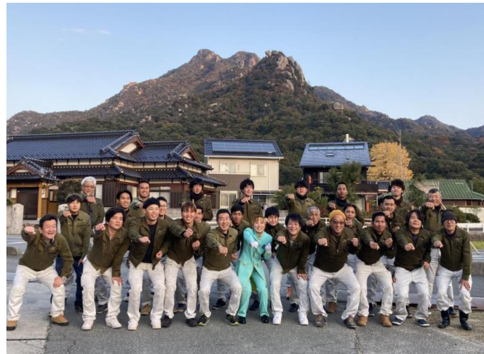
集合写真 (令和6年度やまぐち働き方改革優良企業表彰記念)

こうした状況の中で、高齢者が持つ豊富な経験と知識を活かすことが、企業の持続的な発展に欠かせない取り組みであると感じていました。