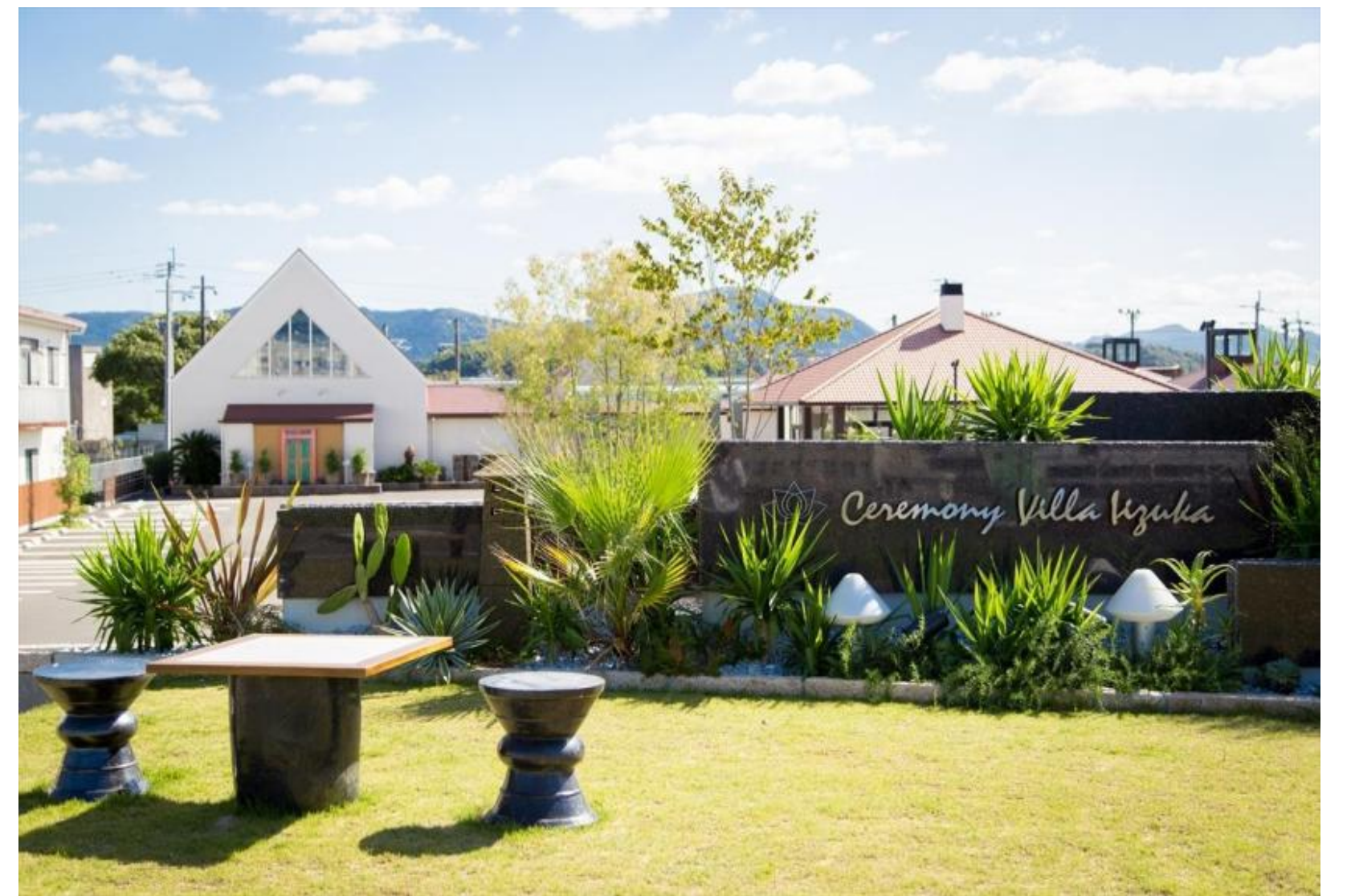
リゾートをイメージした斎場「セレモニーヴィラ飯塚」 『最後の家族旅行』をコンセプトにしています

当社は創業112年。地域で最も古い葬儀社であり、安心と信頼を大切にしています。葬儀は人生最後のセレモニーであり、貴重で大切な時間を経験します。高齢者の方は、豊富な知識と人生経験をお持ちであり、お客様への細やかな気配りや対応において、その力を存分に発揮されています。高齢者の方々が「働くこと」を生きがいとして感じていただけるような職場づくりに努めています。