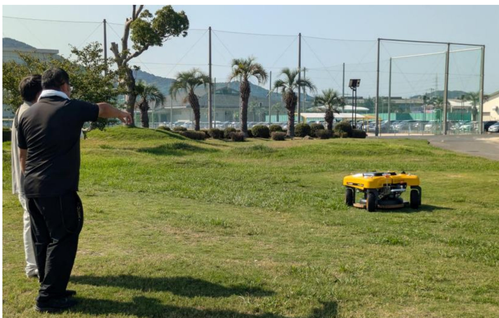
草刈りロボットを活用した業務風景

私どもの長年培った経験が現場や若手に重宝されることは大変うれしく、楽しみながら交流させてもらっています。引き続き力を発揮できる制度は会社の大きな強みだと感じています。また、若手との技術交流を通じて新しい知識を教わりながら、互いに刺激し合える職場づくりを意識しています。今後も体への負担を軽減し、誰もが安心して働ける環境を整えていきたいと思っています。