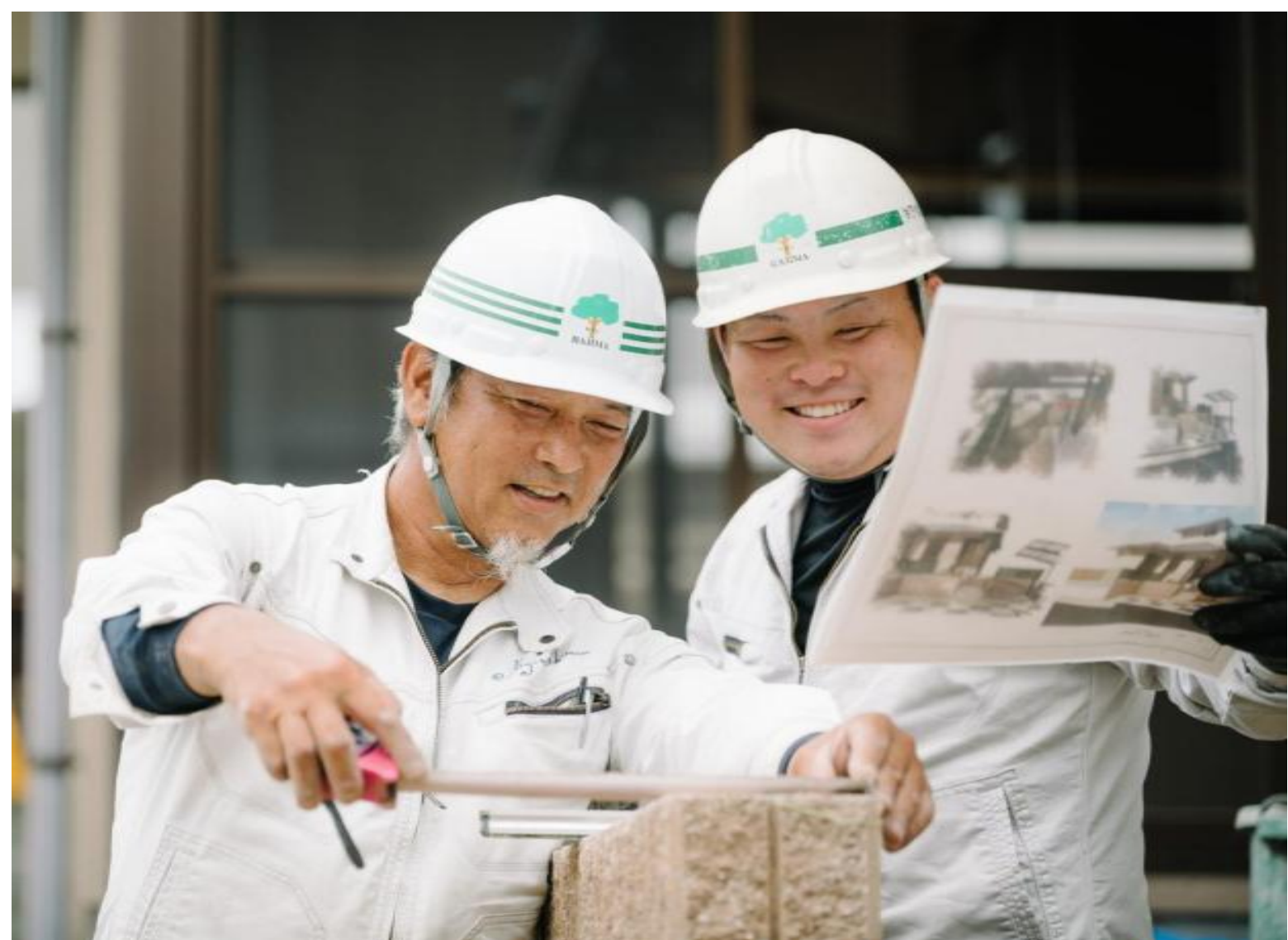
若手社員との技術交流