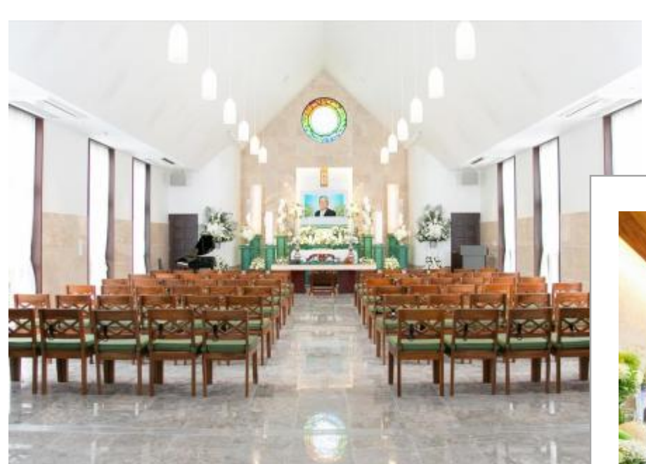
「メモリアルホール」では ヴァイオリンとピアノの 生演奏による献奏を