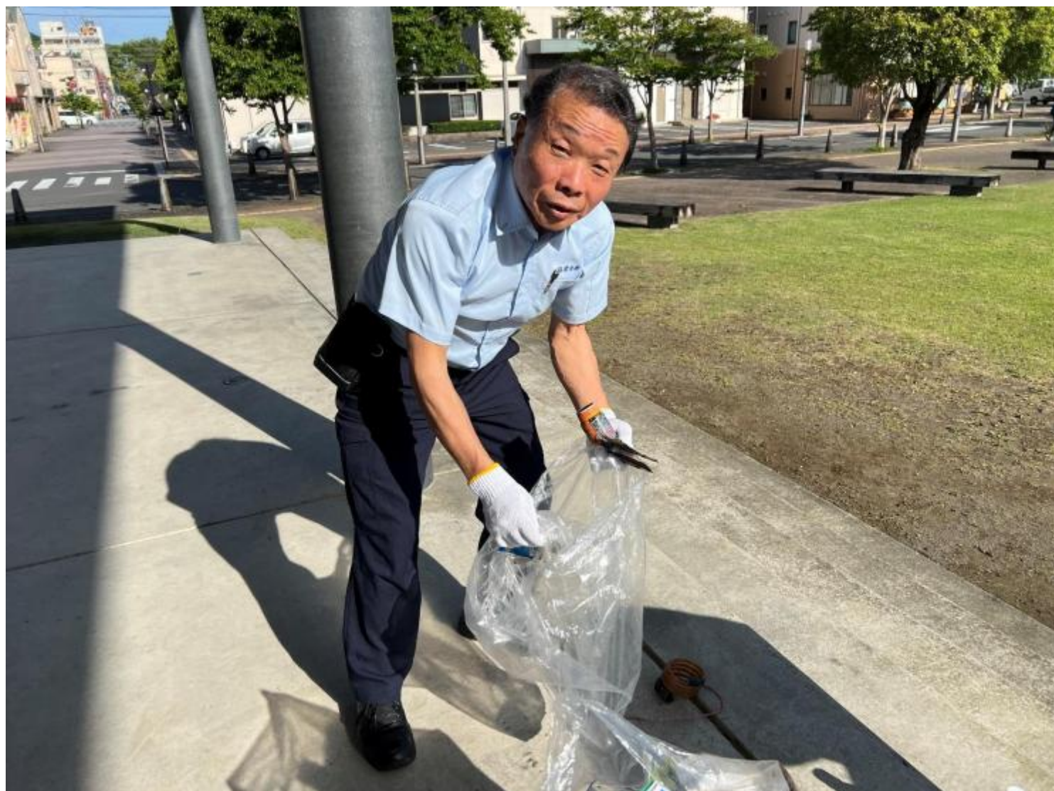
清掃活動に参加する社員（74歳）