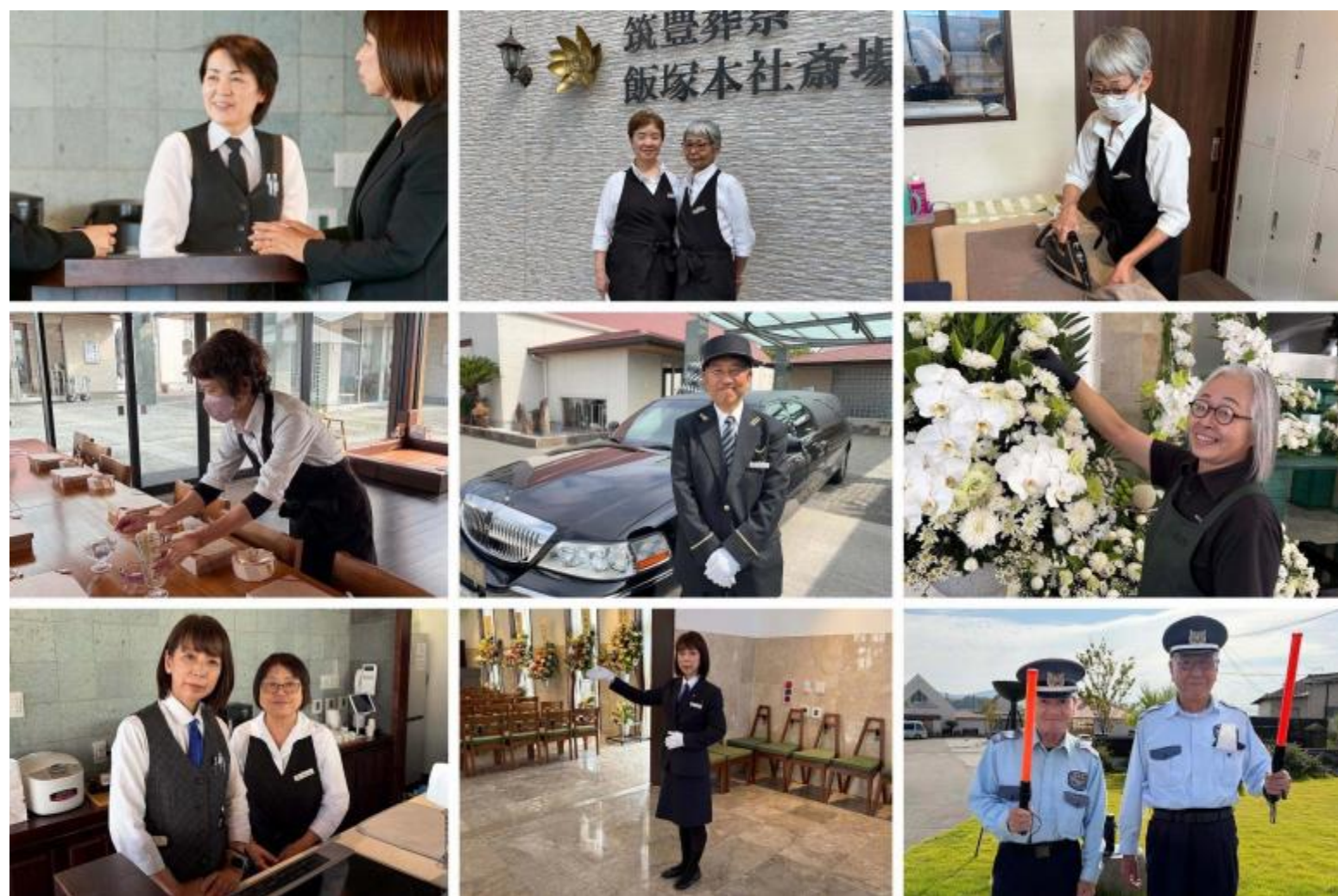
活躍する経験豊かな社員さん・パートさん 最高齢は85歳の警備さん