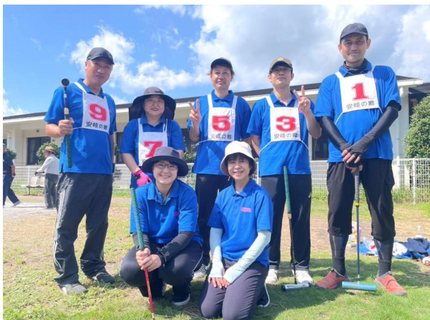
地域のゲートボール大会へ職員チームで定期的に参加