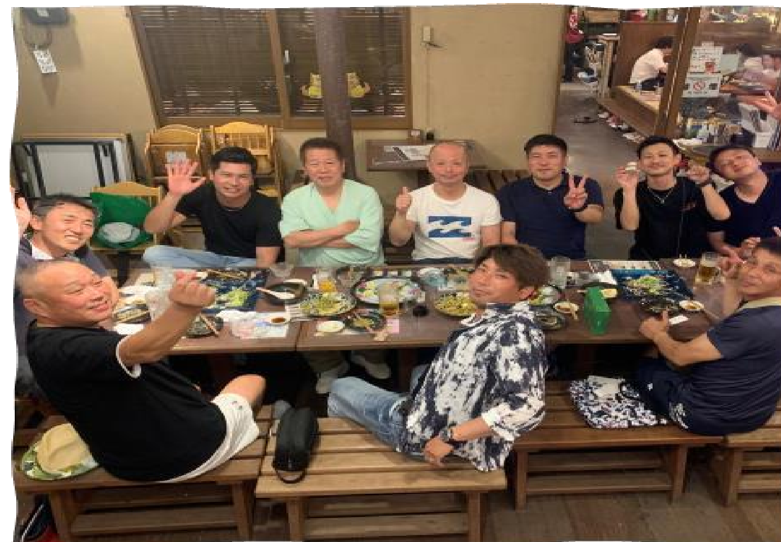
幅広い世代が仲良しです

会社としても社員一人一人と話し合いながら、会社と共に長く生き生きと働いていただきたいという強い想いがありました。