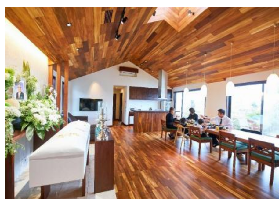
貸切・一戸建てタイプの控室 「Villa House」