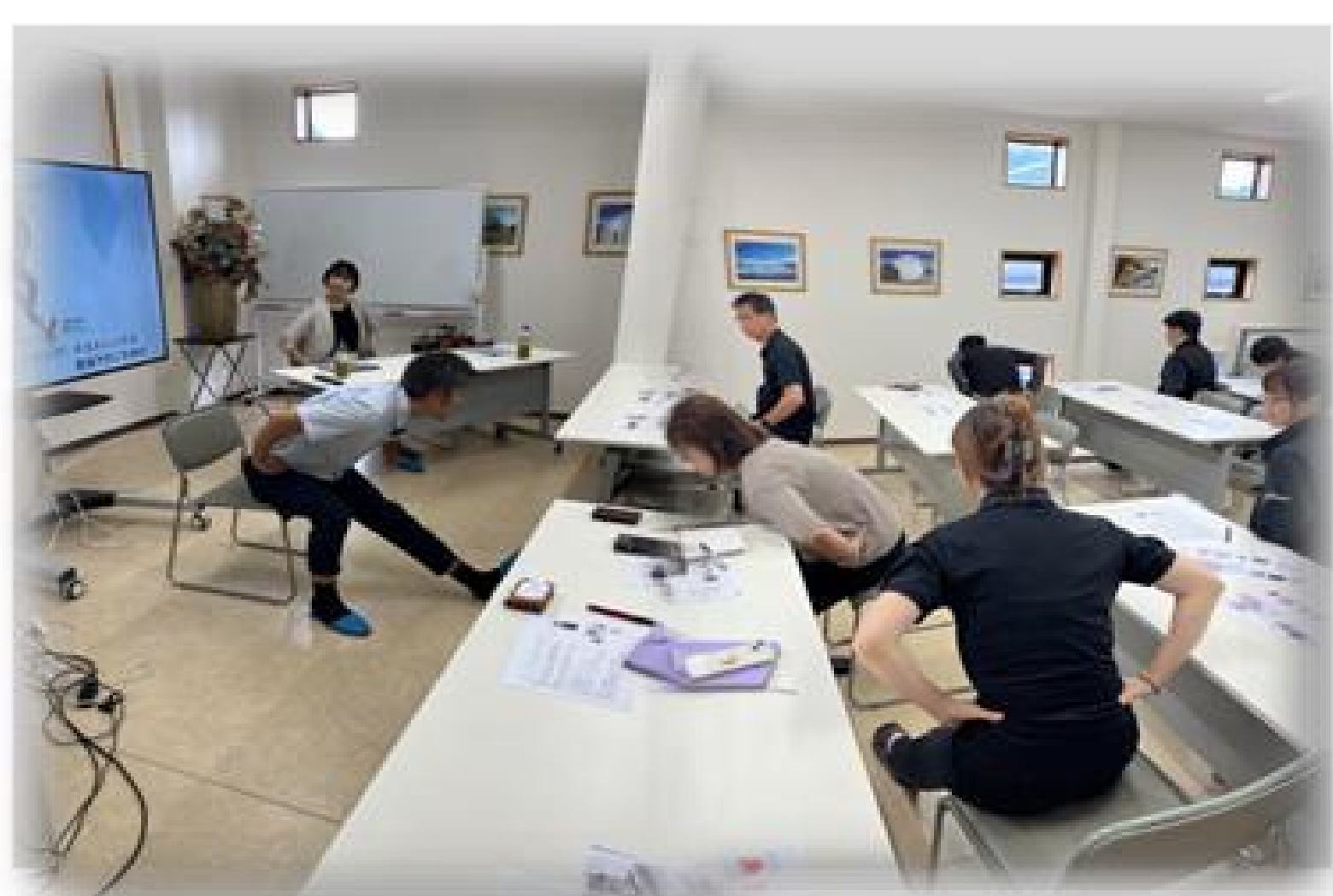
健康セミナーの様子