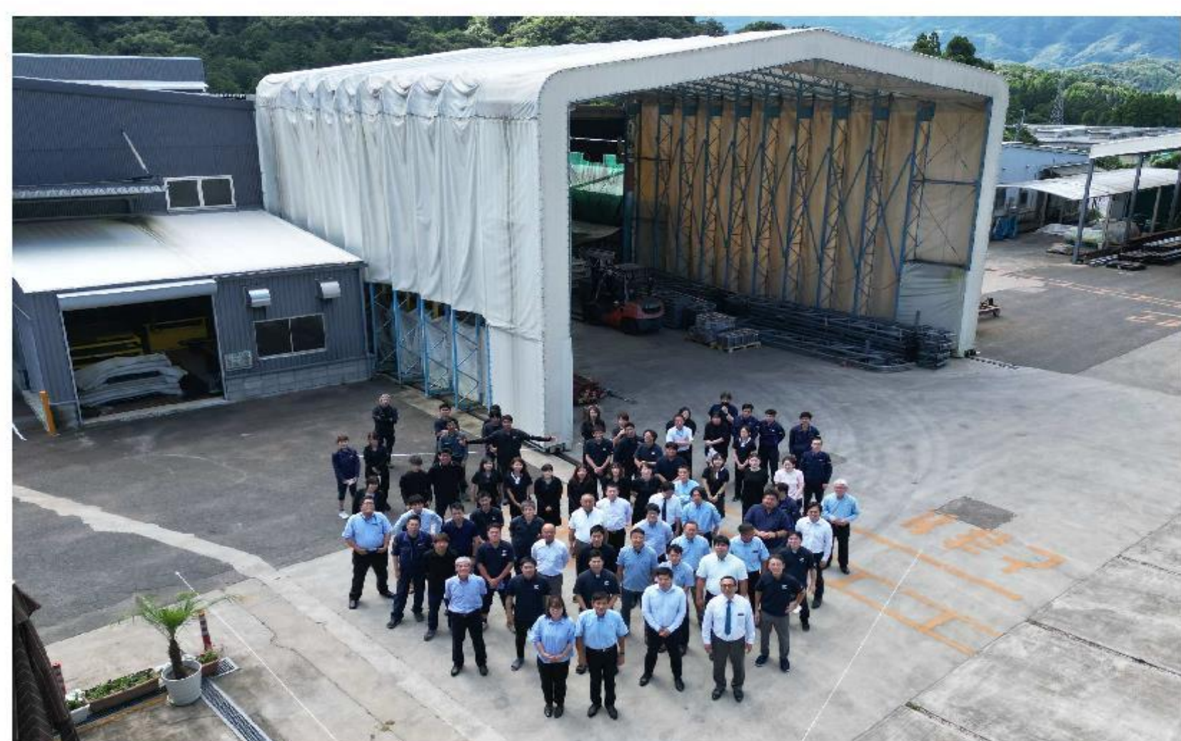
誰もが長く安心して働ける職場を目指しています

長年培った経験を活かしながら若手への指導にも関わることができ、日々やりがいを感じています。働く場があること、仲間と共に過ごせることが、何よりの励みになっています。おかげさまで、安心して70歳を迎えることができました。