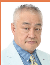
横田 滋：原田大二郎