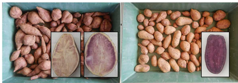
図1 塊根の外観と肉色(左から「おぼろ紅」、「ちゅら恋紅」)

注) 断面は「おぼろ紅」(左) 島尻マージ、(右) ジャーガル、「ちゅら恋紅」島尻マージでの春植え栽培によるもの