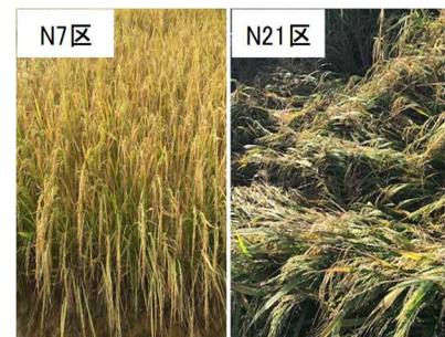
図2 施肥試験の倒伏

4)成熟期に調査し、達観による0(無)、1(微)、2(少)、3(中)、4(多)、5(甚)の6段階評価。