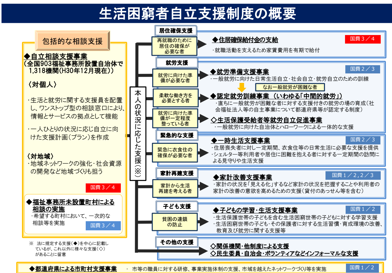
図表 2 生活困窮者自立支援制度による包括的な支援

なお、子どもの学習・生活支援事業を除き、生活保護受給者は、法に規定する各種事業の対象には含まれず、生活保護受給者については生活保護法（昭和 25 年法律第 144 号）に基づき福祉事務所が支援を行うこととなる。いずれにせよ、法に基づく事業と生活保護法に基づく事業とが密接に連携して、切れ目のない支援を提供することが重要である。