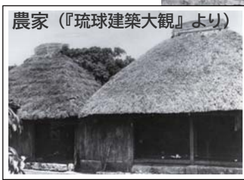
農家（『琉球建築大観』より）