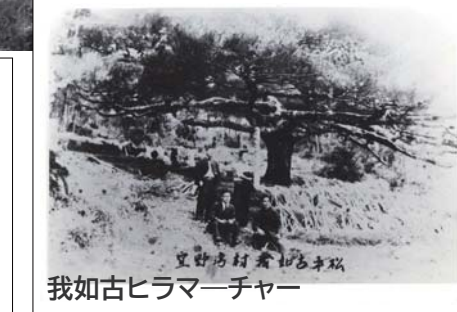
我如古ヒラマーチャー