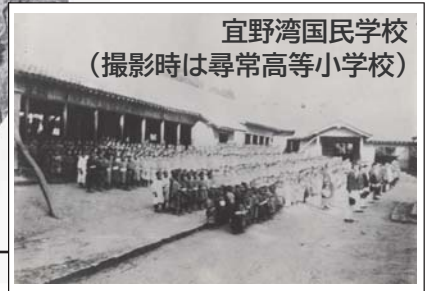
宜野湾国民学校 （撮影時は尋常高等小学校）