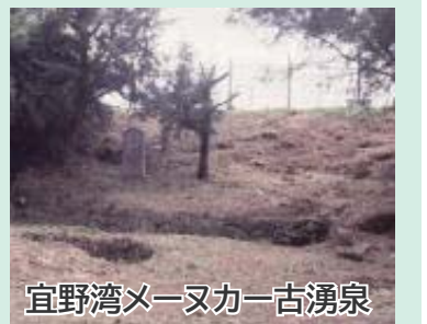
宜野湾メヌカー古湧泉