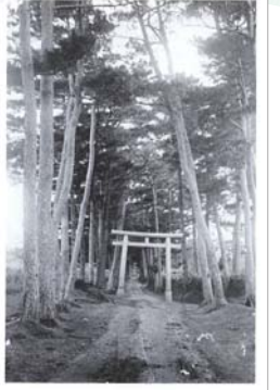
宜野湾並松と一の鳥居