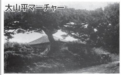
大山平マーチャー