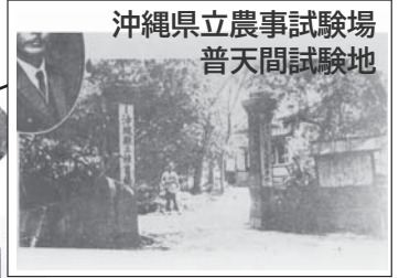
沖縄県立農事試験場 普天間試験地