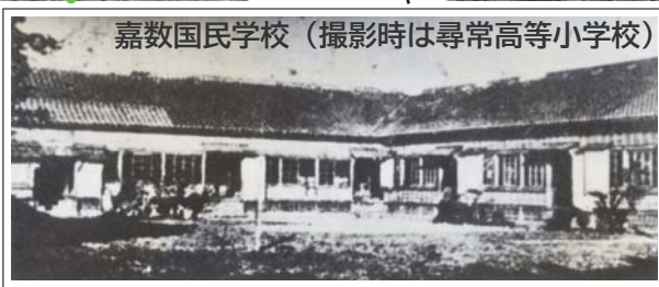
嘉数国民学校（撮影時は尋常高等小学校）