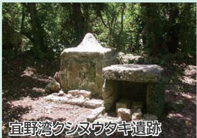
宜野湾クシヌウタキ遺跡