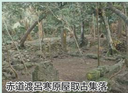
赤道渡呂寒原屋取古集落