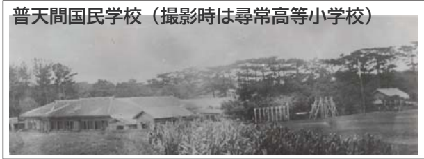
普天間国民学校（撮影時は尋常高等小学校）