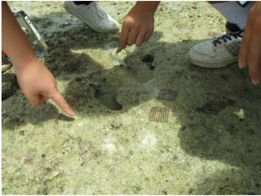
フタのネットです。