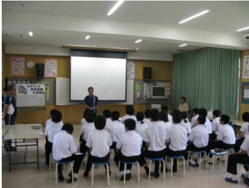
学習会の前に、校長先生のあいさつです