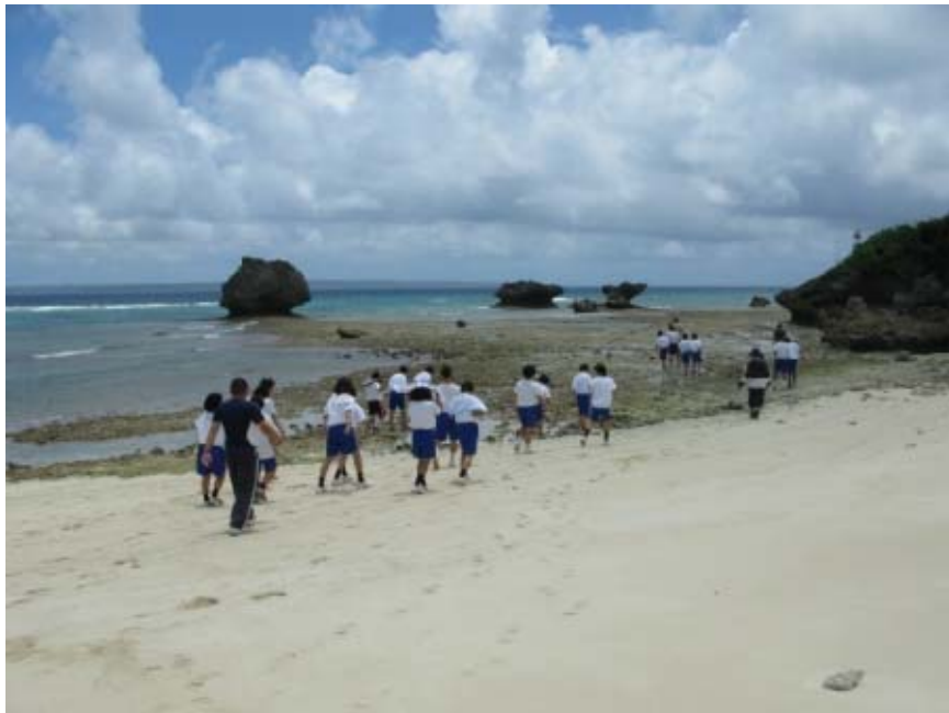
放流現場に向かいます。 きれいな海です。