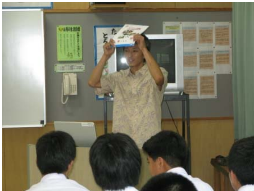
今年度は、「全国豊かな海づくり大会」の活動の一環で行うので、上等な「手引き」を用意してます。