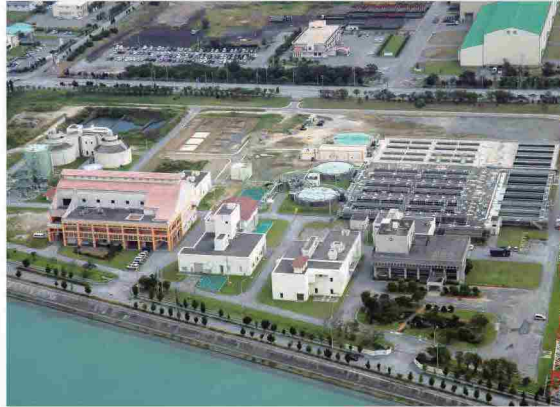
具志川浄化センター(みずクリン具志川)