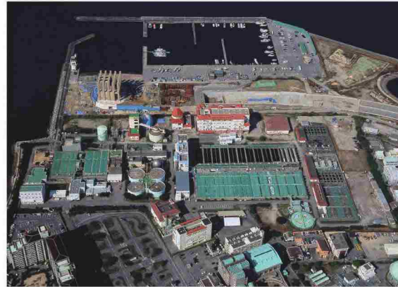
那覇浄化センター(みずクリン那覇)