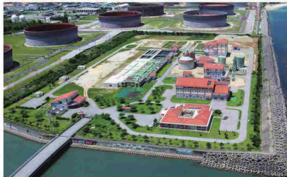
西原浄化センター(みずクリン西原)