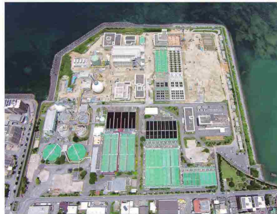
宜野湾浄化センター(みずクリン宜野湾)