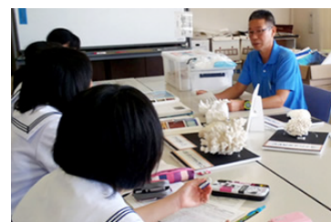
インタビュー学習