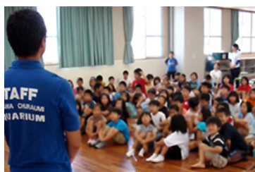
講師派遣（事前学習）

事前学習や来館時に各種教育プログラムをご利用いただけます。お申込み方法等、詳しくはホームページをご確認ください。