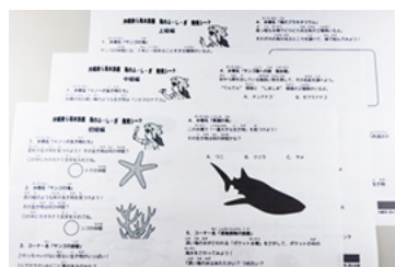
海のふしぎ 発見シート