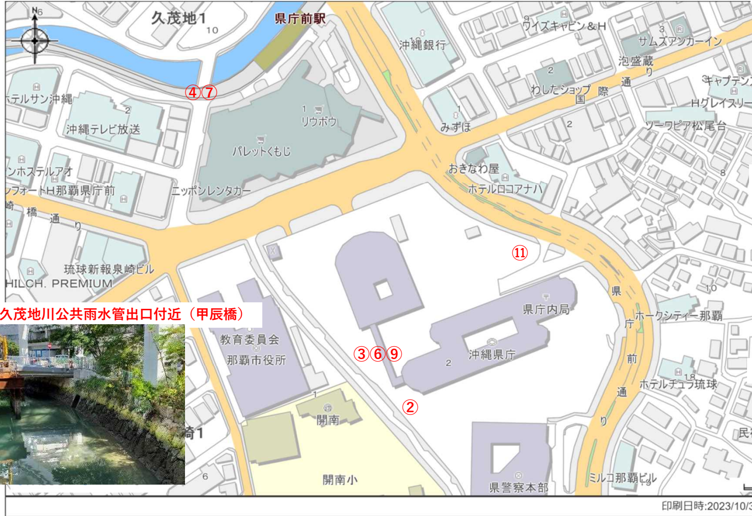
②建物外直近排水柵 (駐輪場)