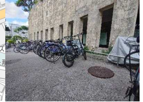
③⑥⑨敷地境界付近排水柵 (市役所側)