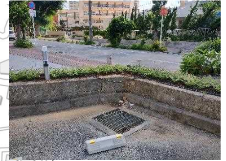
⑪敷地境界付近排水柵 (県道側)