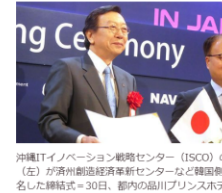
沖縄ITイノベーション戦略センター(ISCO)の(左)が済州創設経済新センターなど韓国ホテル名なし締結式=30日、都内の品川プリンスホテル