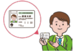
調査員は調査員証を携帯しています。

令和5年10月1日（日）現在で調査を実施します。 県知事に任命された統計調査員が、調査対象となる世帯にお伺いしますので、ご協力をお願いします。