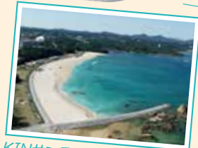
KINサンライズビーチ海浜公園