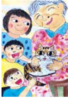
令和4年度 動物愛護図画コンクール 沖縄県知事賞 「ひいおばあちゃんと ねこのチビは仲よし」

動物愛護週間や関連イベントへの参加を通して、動物を飼っている人だけでなく飼っていない人も、「人」と「動物」のよりよい関係を考えるきっかけにしていだけたらと思います。