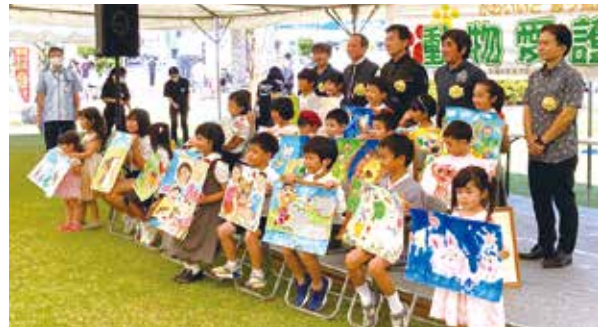
令和4年度「動物愛護の集い」動物愛護図画コンクール表彰式

問い合わせ 自然保護課 電話：098-866-2243 FAX：098-866-2855