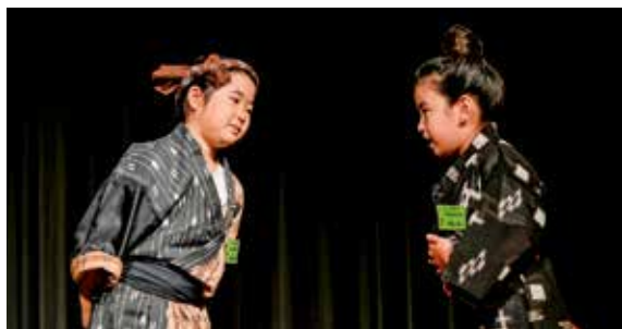
しまくとぅば 語やびら大会の様子

その中でも、今年で第28回目を迎える「しまくとぅば語やびら大会」では、各市町村文化協会と市町村の推薦を受けた話者が、それぞれの地域自慢の「しまくとぅば」を披露してくれます。