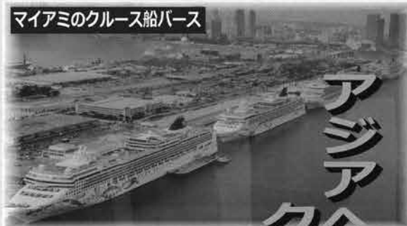
マイアミのクルーズ船バース

意見交換では沖縄への誘客、那覇港バースの整備、税関手続きなど様々な課題や問題点が出され、今後はこれらを県としてどのように克服、強化していくかが求められます。