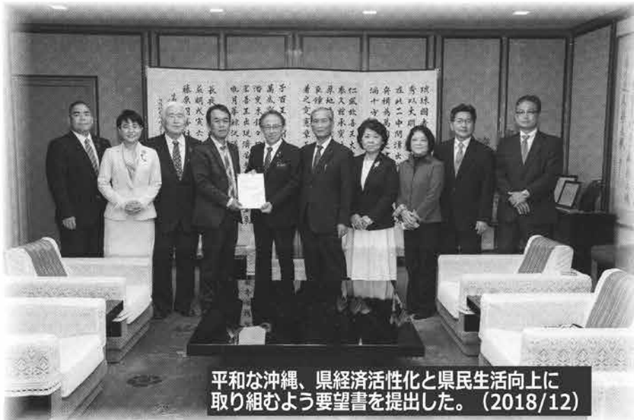
平和な沖縄、県経済活性化と県民生活向上に取り組むよう要望書を提出した。(2018/12)