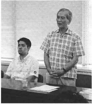
学習会に県民投票の会の元山仁士郎代表を招いた。