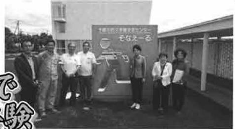
防災体験施設で震度7の揺れを体験した。

社民・社大・結連合会派は昨年7月に北海道を視察。衛生管理型施設のウトロ漁港、延期となっている沖縄の山原・西表の世界自然遺産登録に向けて、オホーツク海と知床沿岸の生態系などを視察しました。