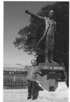
「少年よ大志を抱け」で有名な北海道開拓の父「クラーク博士像」の前で