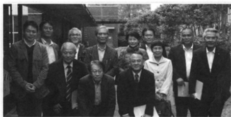
▲大屋教授を囲んで

九州大学では、大屋裕二教授が洋上に設置した浮体に風力・太陽光・潮力、そしてアンカーケーブルに動く張力といったエネルギー源を利用した複合的な発電システムを備えたファームの説明をした。