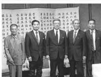
伊良皆多良間村長に同行、村の振興を要請。多良間村は息子の嫁の出身地である。