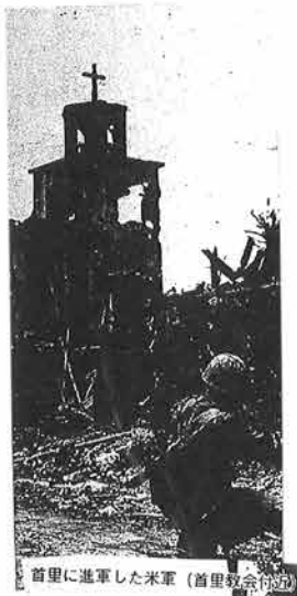
首里に進軍した米軍(首里教会前)