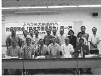
漁業者に痛手を与える日台へ、棚原議員は沖水の後輩。