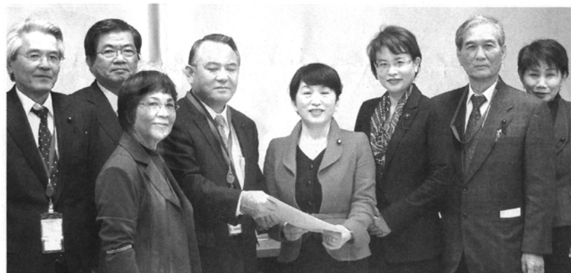
▲福島みずほ社民党副党首へ要請（県議会経労委）2月

設を公約に掲げながら埋め立て承認したことは72.4%の県民が公約違反だとし、知事の支持率は24%に急落していることから伺い知れる。では、具体的に、知事公約埋立承認、県議会の反対決議、名護市長意見、41市町村長の建白書等知事の立場を問ひ質す。