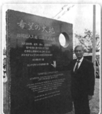
カンボグランデ市の希望の大地の前で