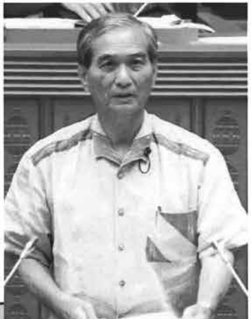
6月議会で登壇、県政のかつてない厳しい情勢下、所感を述べるサキ山議員。