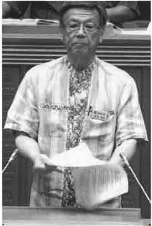
サキ山議員の所感と質問に答える翁長知事

6/16～7/10まで開かれた6月定例県議会で、サキ山議員は質問に立ち、県政の重要な時期にあつて、沖縄戦や安保法制、百田発言など所感を表明。与党派提案の「県外からの土砂搬入規制条例案」や離島地域の振興策について、知事に質した。