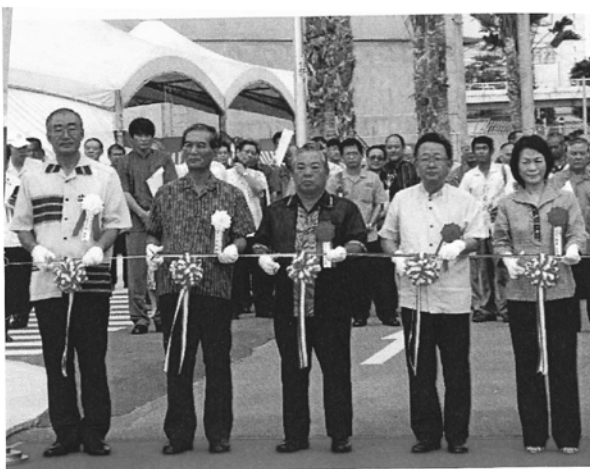
2008年9月6日港湾議長として臨海道路開通式典

*大城教育長答弁：沖縄学生寮検討会議では、改築は困難であると結論づけた。首都圏へ進学する学生に対し、南灯寮、冲英寮での対応と奨学金による支援をしていく。