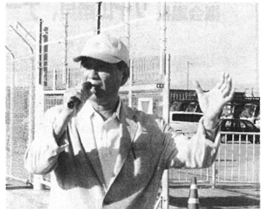
教科書問題で県民へ正しい教科書採択を訴える

は9月8日の協議で、同一の教科書採択が行われたとの見解を述べているが、教育長はこの協議が有効だと認識しているか。