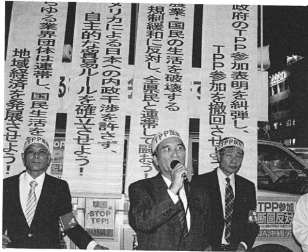
TPP 反対県民決起集会

負担軽減、幼児教育の充実、小学校との円滑な接続を目指した新たな振興策の中で提案し、沖縄型幼稚園の実現に取り組み。沖縄幼児教育振興アクションプログラムを通し、市町村新規採用の拡大と、職員の待遇改善を促した。