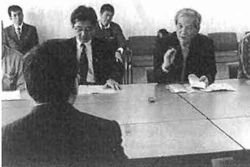
米軍流弾事件への抗議 2