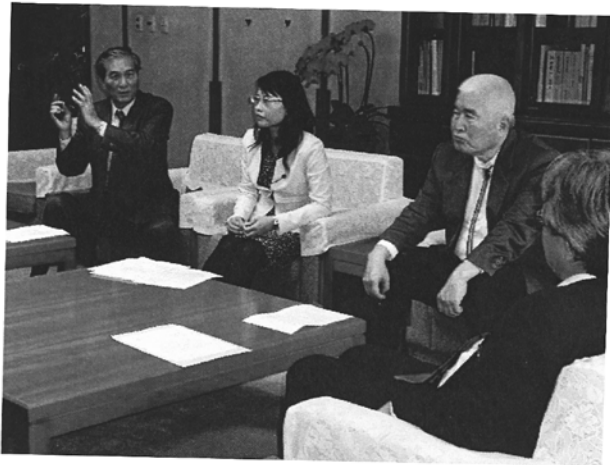
2009年1月11日震災に関する要請

ランドの確立と生産供給体制を強化していく。また、ゴーヤー等の園芸作物の施設整備を図る。漁業生産額は157億であり、モズク、海ぶどう、車エビ等の養殖技術を高め、品種開発や国内外の需要拡大を図る。