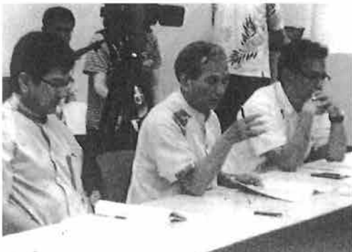
米軍流弾事件への抗議 1