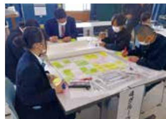
指導者等へのメッセージを検討する様子