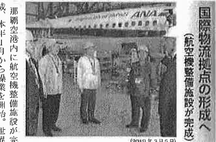
国際物流拠点の形成へ(航空機整備施設が完成)

公明党県議団は、沖縄防衛局に対し米空軍嘉手納基地所属のF15戦闘機が、訓練中に沖縄本島の南方約80キロ沖に墜落した事故に厳重に抗議。沖縄が異常な状態にあることを真摯に受け止め、対策を直ちに講じるよう強く迫った。