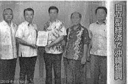
自立型経済を築く沖縄振興

公明党沖縄県議団として、石井啓一国土交通大臣に沖縄振興と社会資本整備の拡充に関する要請書を手渡す。要請項目は①那覇空港のさらなる機能拡充②那覇空港駐車場の早期整備と国際線レンタカー送迎バス乗り場に屋根を設置③国際クルーズ拠点を整備推進④大型MICE設置の早期整備⑤鉄軌道の実現への取り組み⑥沖縄自動車道の各出口の渋滞緩和対策の実施⑦西海岸道路の未整備箇所の整備⑧国直轄工事などを県内建設関連業者に優先発注⑨公共施設などにおけるタクシー待機場・乗降場の整備