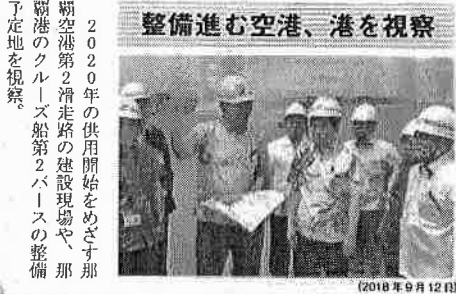
整備進む空港、港を視察

2020年の供用開始をめざす那覇空港第2滑走路の建設現場や、那覇港のクルーズ船第2バースの整備予定地を視察。