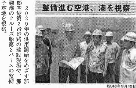
2020年の供用開始をめざす那覇空港第2滑走路の建設現場や、那覇空港のクルーズ船第2パースの整備予定地を視察

整備進む空港、港を視察 2020年の供用開始をめざす那覇空港第2滑走路の建設現場や、那覇空港のクルーズ船第2パースの整備予定地を視察