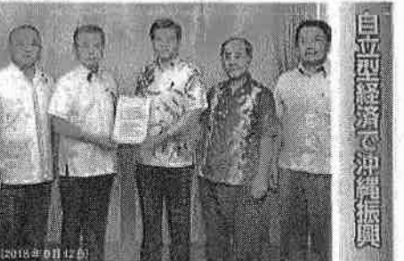
公明党沖縄県議団として、石井啓一国土交通大臣に沖縄振興と社会資本整備の拡充に関する要望書を手渡す。要望項目は①那覇空港のさらなる機能拡充②那覇空港駐車場の早期整備と国際線レンタカー送迎バスの乗り場に屋根を設置③国際クルーズ拠点の整備推進④大型MICE施設の早期整備⑤鉄軌道の実現への取り組み⑥沖縄自動車道の各出口の渋滞緩和対策の実施⑦西海岸道路の未整備箇所の整備⑧国直轄工事を県内建設関連企業に優先発注⑨公共施設などにおけるタスクシフト待機場・乗降場の整備

整備進む空港、港を視察 2020年の供用開始をめざす那覇空港第2滑走路の建設現場や、那覇空港のクルーズ船第2パースの整備予定地を視察