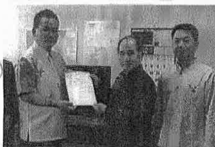
（渡嘉敷村長より要請）

【答弁】渡嘉敷港は南東からのうねりの影響や台風の後波等によってフェリーの接岸や荷役作業に支障が生じる状況にある。県は平成29年度から、港内静穏度の向上を図るための調査を実施。今後、フェリーバースの移設も含めて対策を検討。（上原土木建築部長）