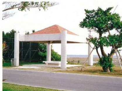
名称：総合運動公園東屋(AZ-1) 3棟 所在地：沖縄市宇比屋根672 工期：平成11年10月2日～平成22年2月28日 構造：鉄筋コンクリート造(平屋建) 延面積：36㎡×3棟 設計：株国建 総工事費：12,875千円 施工：建築：衛長兵建設