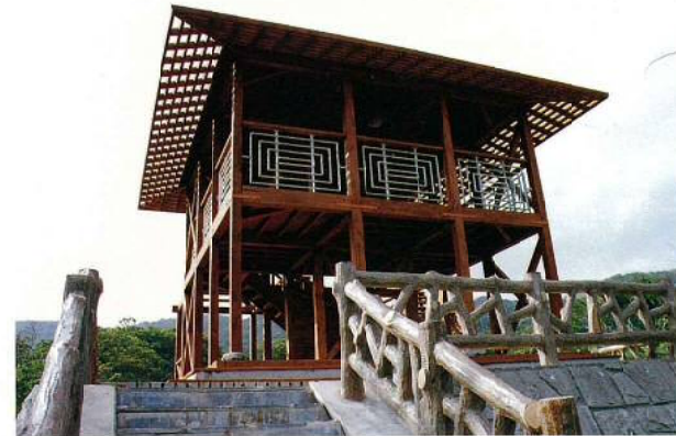
名称：バナナ公園Cゾーン展望台、その他 所在地：石垣市登野城2241-1 工期：平成11年10月2日～平成22年2月28日 構造：木造 延面積：70㎡ 設計：互設計室 総工事費：28,622千円 施工：建築：秀光建設