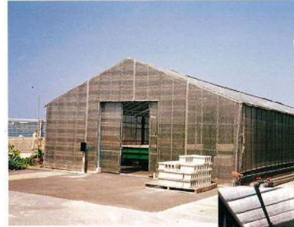
名称：栽培漁業センター温室 所在地／本部町 工期／平成2年1月29日～平成2年3月13日 構造／鉄骨造(平屋建) 延面積／225㎡ 設計／山川建築設計事務所 総工事費／3,811千円 施工／建築：盛吉組