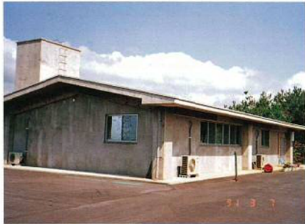
名称：畜産試験場受精卵移植研究室 所在地／今帰仁村 工期／平成1年8月25日～平成1年12月22日 構造／鉄筋コンクリート造(平屋建) 延面積／134㎡ 設計／ナカソネ一級建築士事務所 総工事費／20,385千円 施工／建築、設備：鳥政建設