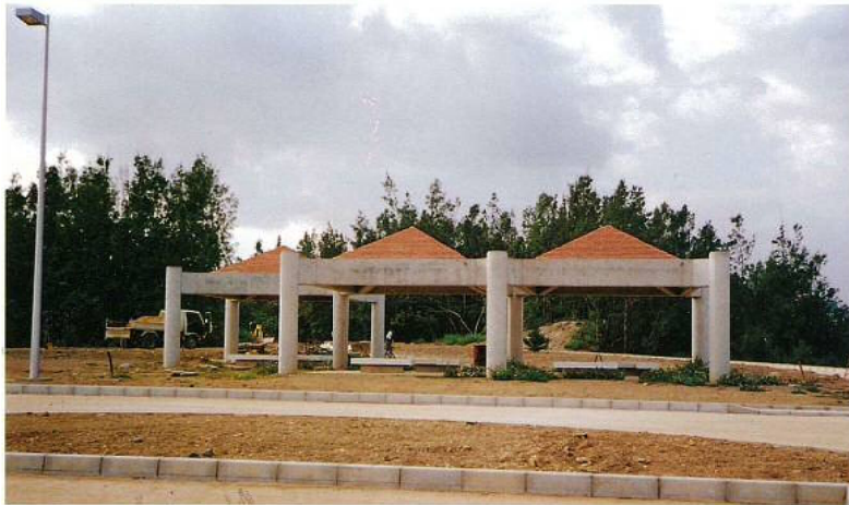
名称：総合運動公園東屋(AZ-3) 1棟 所在地：沖縄市宇比屋根672 工期：平成22年2月2日～平成22年3月27日 構造：鉄筋コンクリート造(平屋建) 延面積：108㎡ 設計：株国建 総工事費：11,893千円 施工：建築：南安里工務店