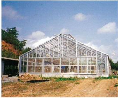
名称：農業試験場名護支場ハイブリッドライス育成温室 所在地／名護市 工期／平成1年8月22日～平成1年12月19日 構造／鉄骨造(平屋建) 延面積／180㎡ 設計／南ヨシ企画設計 総工事費／19,295千円 施工／建築：岡大三組 設備：金城電器