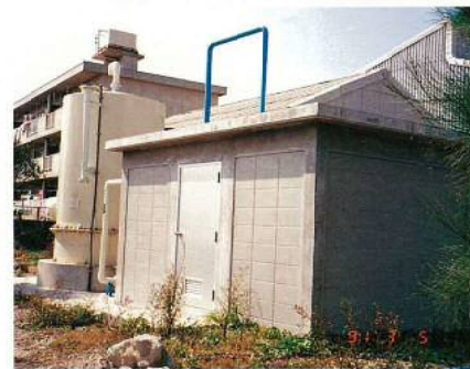
名称：水産試験場海水濾過施設 所在地／糸満市 工期／平成1年11月1日～平成2年2月28日 構造／補強コンクリートブロック造(平屋建) 延面積／38㎡ 設計／尚久総建築設計室 総工事費／28,478千円 施工／建築：神谷建設 設備：沖縄総合設備株