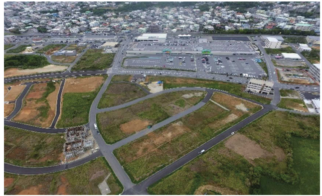
中部広域都市計画事業 読谷村大湾東土地区画整理事業