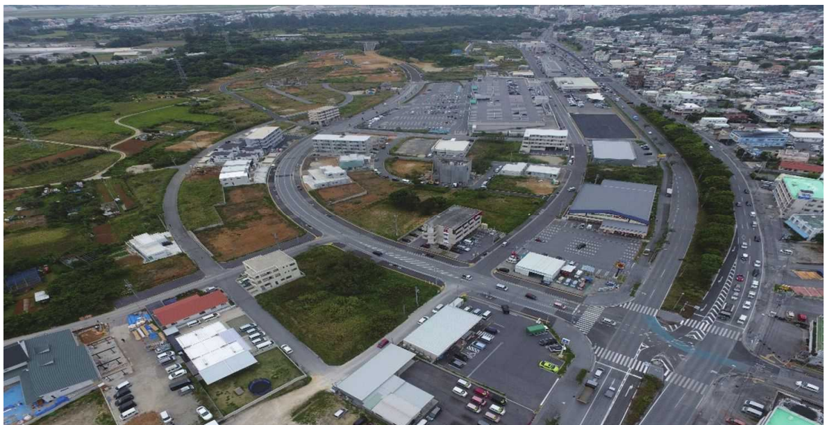
土地区画整理事業設計図及び区内現況写真