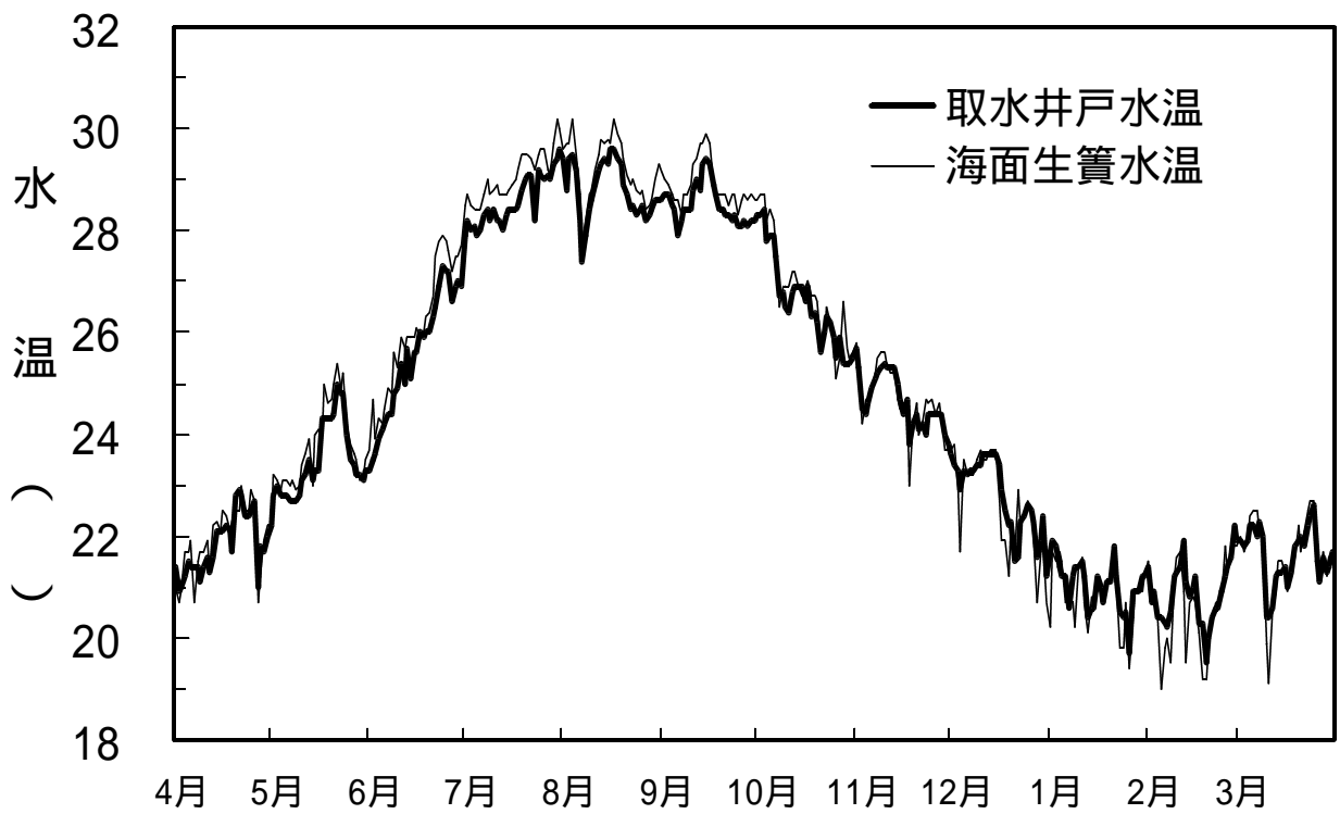
資料7 取水井戸及び海面生簀の日水温の推移