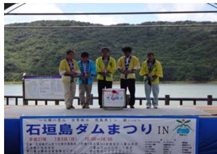
石垣島ダムまつり (ふるさと農村活性化基金事業)