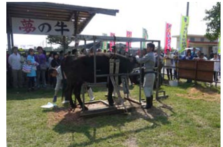
黒島牛まつり (ふるさと農村活性化基金事業)