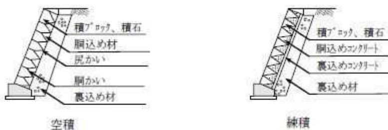
図 3-5-1 コンクリートブロック工 標準断面図