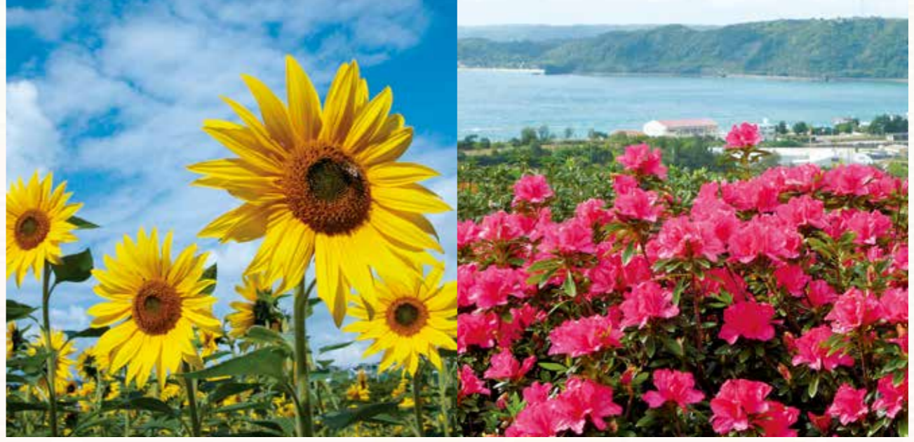
「沖縄花のカーニバル2015」の情報はこちらから▶ http://www.okinawastory.jp/special/osusume_flower_carnival/event.html