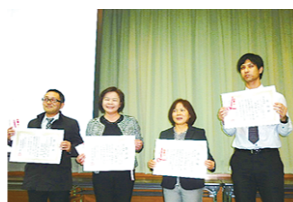
第6回沖縄県立病院運営研究会