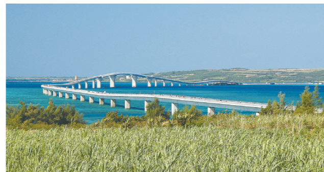
全長3540メートル、国内最長の無料の大橋となる伊良部大橋

伊良部島と宮古島を結ぶ全長3540メートルの伊良部大橋が31日に開通した。開通式典には内閣府の松本洋平大臣政務官や翁長雄志知事、下地敏彦宮古島市長ら関係者が出席し、テープカット等が行われた。伊良部大橋は平成17年度に着工し、総事業費は約395億円。橋の開通により救急医療の質の向上、経済の活性化、教育環境の向上等が期待される。