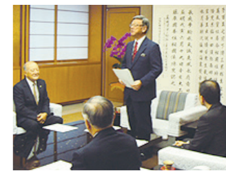
翁長知事による就任あいさつの様子

平成27年1月1日付けで日本赤十字沖縄県支部長に就任した翁長知事への委嘱状の交付が沖縄県庁で行われた。支部長は知事が就くのが慣例で、任期は3年。