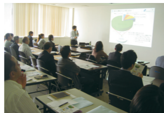
平成26年度製塩技術講習会