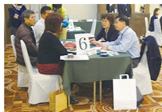
沖縄県産農林水産物海外販路拡大支援事業による海外バイヤー招聘商談会