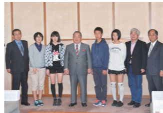
岩手県大船渡市児童による安慶田副知事表敬