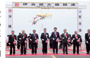
松本大臣政務官、翁長知事、下地市長らによるテープカットの様子

伊良部島と宮古島を結ぶ全長3540メートルの伊良部大橋が31日に開通した。開通式典には内閣府の松本洋平大臣政務官や翁長雄志知事、下地敏彦宮古島市長ら関係者が出席し、テープカット等が行われた。伊良部大橋は平成17年度に着工し、総事業費は約395億円。橋の開通により救急医療の質の向上、経済の活性化、教育環境の向上等が期待される。