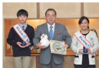
福島県雪だるま親善大使による安慶田副知事表敬