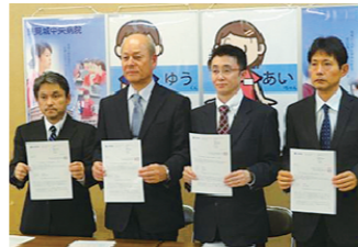
再生医療認定医認定報告会見