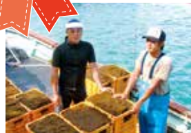
船に積み込まれた水揚げしたばかりのもずく。

全国シェアの約9割を占める沖繩のもずく。その約5割をうるま市のもずくが占め、日本一の生産量を誇っています。主な生産地であるうるま市勝連地域では昭和50年代から養殖がスタート。現在、漁港から船で30分ほどの沖合一面に見事な漁場が広がっています。3月から6月頃までが収穫のシーズンで、4月の第3日曜日の「もずくの日」には漁港でイベントを開催。船に乗り込んでの漁場見学や、もずくのつかみ取りなどで賑わいます。また、勝連漁協ではもずくを使った加工商品の開発にも意欲的で、続々と新商品が生まれています。