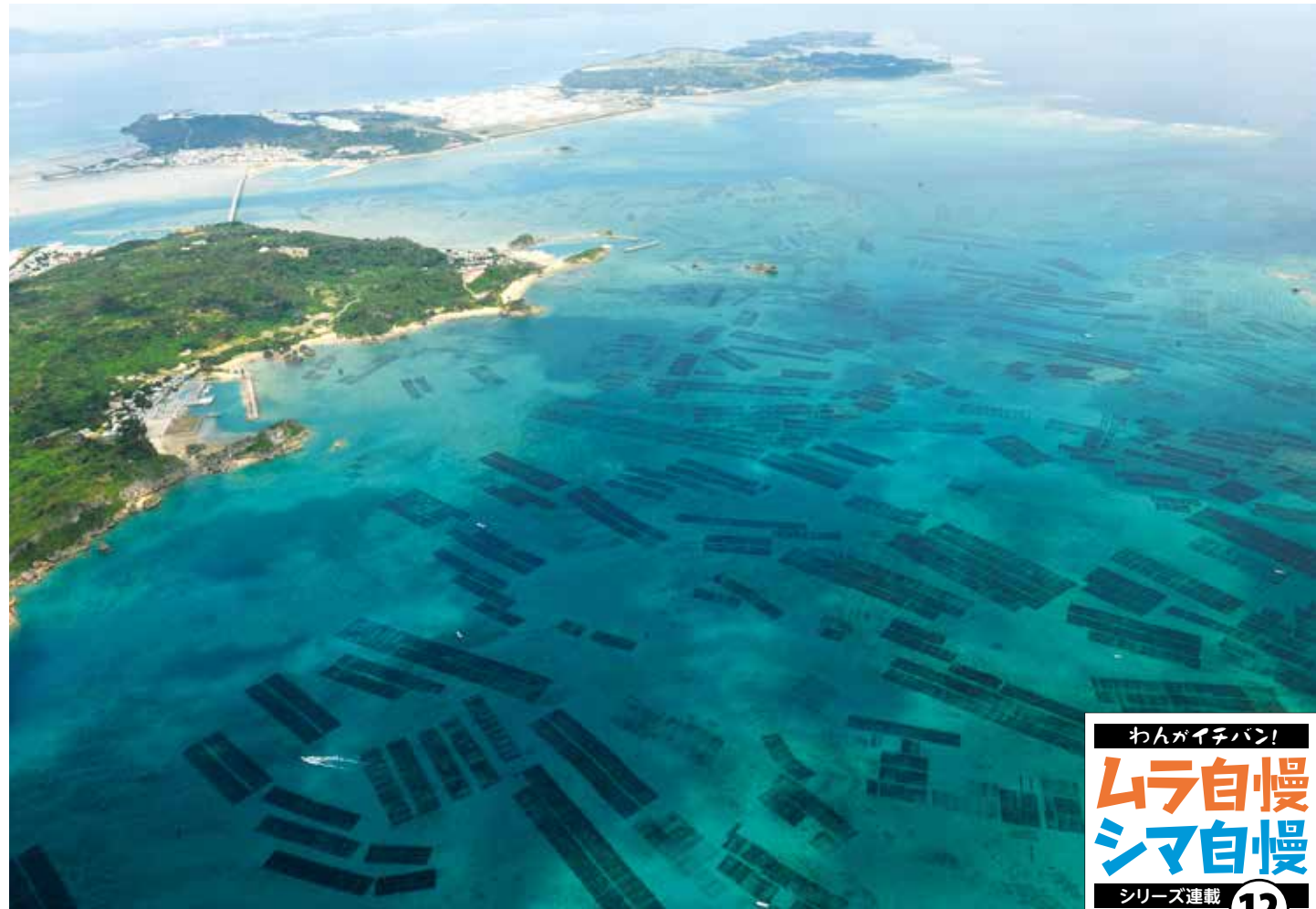
勝連漁港からほど近い美しい海に広がるもずくの漁場

豊かな表情でエネルギーに満ちた未来を育む 沖繩本島中部の東海岸沿いに位置するうるま市は、豊かな自然のもと、世界遺産に登録される勝連城跡や、青い海に伸びる海中道路など、美しいスポットが点在する街。さらに、迫力あふれる闘牛やエイサーといった伝統文化に加え、中高生による現代版組踊「肝高の阿麻和利」や、伊計島でのアートプロジェクトなど新たなチャレンジにも熱心な地域です。 農業では基幹作物のサトウキビを中心に野菜や果樹、花き栽培が盛ん。人参やオクラ、マンゴー、菊などを含む7つの品目の拠点産地に認定。また、水産業においては、日本のもずく生産地として知られ、資源を活かした産品・特産品づくりに力を注いでいます。 バイオマスタウン構想や中城湾新港地区での新たな拠点形成などでも注目を集めるうるま市。可能性に満ちた街は、今後もさまざまな話題を提供してくれそうです。