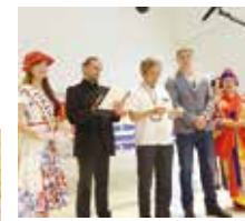
取材対応(昨年の様子)

「ミス沖繩」のお仕事について 主に、全国各地や海外で開催される沖繩観光イベントや物産展等で本県の知名度向上のためのPR活動を行っています。また、毎年6月1日のかりゆしウェアの日にあわせて行われている首相官邸でのかりゆしウェア贈呈式、県産マンゴー流通促進イベント等へ参加し、県産品普及のためのセールス活動を行っています。 また、県内では沖繩の「つとむいむち(おもてなし)」の心を伝えるために、来沖される観光客の皆様を那覇空港でお出迎えをする等、沖繩旅行の満足度を向上のために活動しています。 その他にも自動車税納期内納付の呼びかけ、献血の呼びかけ等、観光親善使節としての役割以外にも県民の代表としての活動もしています。