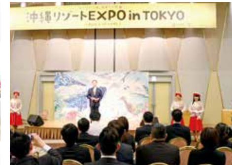
沖繩リゾートEXPO in TOKYO

的・経済的なメリットを県民の皆様が享受し、沖繩がより豊かな郷土となるよう、本県のセールスマンとしてこれからも活動していきます。 ミス沖繩の活動はミス沖繩 Facebookページでもご覧いただけます。 https://www.facebook.com/MissOkinawa3