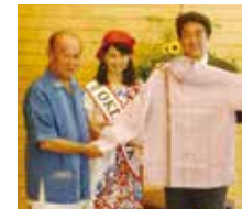
首相官邸でのかりゆしウェア贈呈(昨年の様子)

「ミス沖繩」は1981年にスタートして以来34年間、本県の観光親善使節として活動してきました。任期は1月1日～12月31日まで、毎年3名が選出されています。それぞれに沖繩の美しい空をイメージした「スカイブルー」、綺麗な海をイメージした「コバルトブルー」、緑豊かな自然をイメージした「グリーングリーングレイシャス」の愛称が付いており、厳正な審査の中から選ばれた3名がミス沖繩として活躍しています。