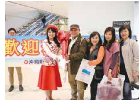
那覇空港での観光客お出迎え