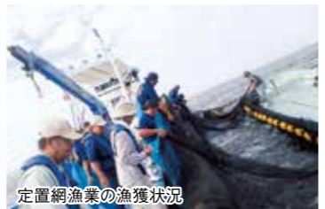
定置網漁業の漁獲状況

沖縄県では、広大な漁場を有効に活用するため、観光産業とも連携を強化しています。例えば、読谷村漁業協同組合や国頭漁業協同組合では、定置網漁業の体験や生魚を県内外の飲食店や国内外の水族館へ観賞魚として販売するなど、漁業と観光を組み合わせた観光漁業及びブルー・ツーリズムに取り組んでいます。