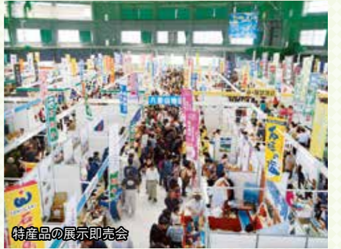
特産品の展示即売会

離島の農林水産加工品、伝統工芸品や泡盛など100を超えるブースで、定番の人気商品や離島フェアで初めてお目見えする商品が並びます。本島ではなかなか手に入らない18離島市町村の特産品が集まる離島フェアならではの物産展です。