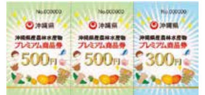
沖縄県産農林水産物プレミアム商品券