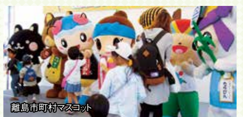
離島市町村マスコット

沖縄の島々に関係する賞品が当たるお楽しみ抽選会や離島市町村のマスコットの参加などもあります。また、特産品の流通商談会も開催しますので、詳しくは事務局へお問い合わせください。