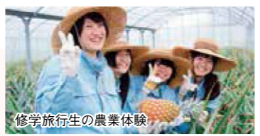
修学旅行生の農業体験

グリーン・ツーリズム研修プログラム等 掲載《HP》 http://www.pref.okinawa.jp/site/norin/muradukuri/kassei/green.html