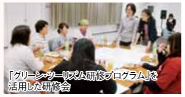
「グリーン・ツーリズム研修プログラム」を活用した研修会