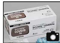
添付イメージ（製品名）

□ また、国が承認した医療用抗原検査キット及び検査結果が陽性であることを確認させて頂くため、⑤使用した検査キットの種類（商品名）、⑥検査の結果（判定ライン）が確認できる写真、⑦本人確認ができる身分証（運転免許証、健康保険証など）の画像を添付して下さい。