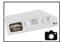
添付イメージ（判定ライン）