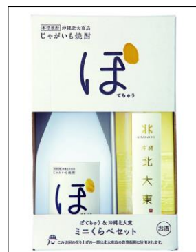
『ほてちゆう&沖繩北大東 ミニくらべセット』

沖縄発のじゃがいも焼酎。 主原料のじゃがいもは、北大 東産ニシュタカの規格外品を 有効活用。 規格・・・720ml