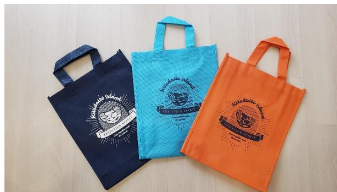
(ネイビー、ライトブルー、オレンジの3色)