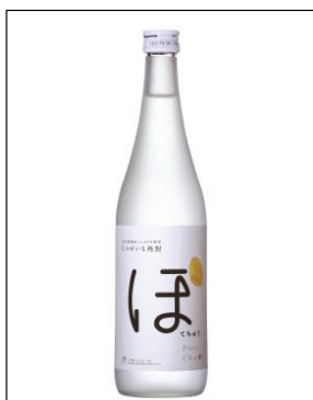
『じゃがいも焼酎 ほてちゆう』

沖縄発のじゃがいも焼酎。 主原料のじゃがいもは、北大東 産ニシュタカの規格外品を有効 活用。 規格・・・720ml