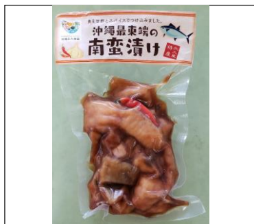
『沖繩最東端の南蛮漬け』

北大東産じゃがいもの規格外品を粉 末化し、小麦に練り込み製麺。ニョッ キのようなモチモチ食感の生麺。常温 で保存可能。 規格・・・100g×2玉