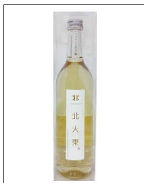
『樽仕込じゃがいも焼酎 沖繩北大東』

沖縄発のじゃがいも焼酎。 主原料のじゃがいもは、北大東 産ニシュタカの規格外品を有効 活用。 規格・・・720ml