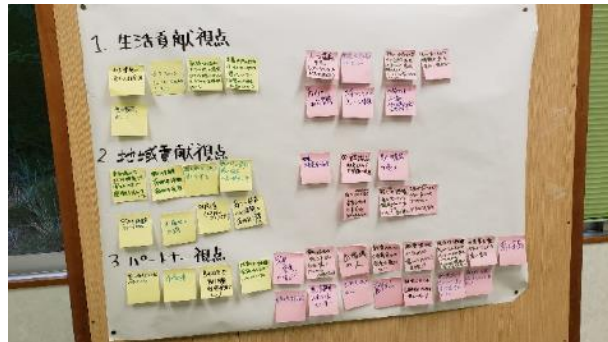
(連携体の構成員全員で、生活貢献視点、地域貢献視点、パートナー視点について議論)