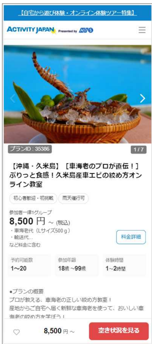
※プラン①掲載イメージ