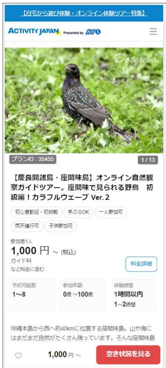
※プラン②掲載イメージ