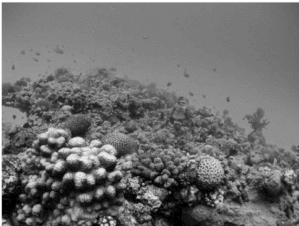
図 4-3-1. 沖縄県サンゴ移植マニュアル（案）の表紙