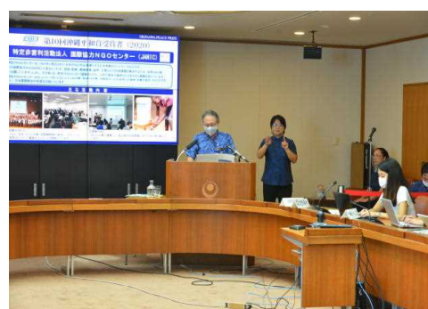
知事定例記者会見

又、各部において重要事項等を発表する場合、部局長等により臨時記者会見を行います。