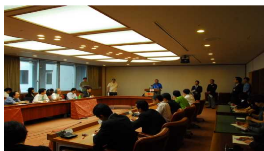
知事定例記者会見