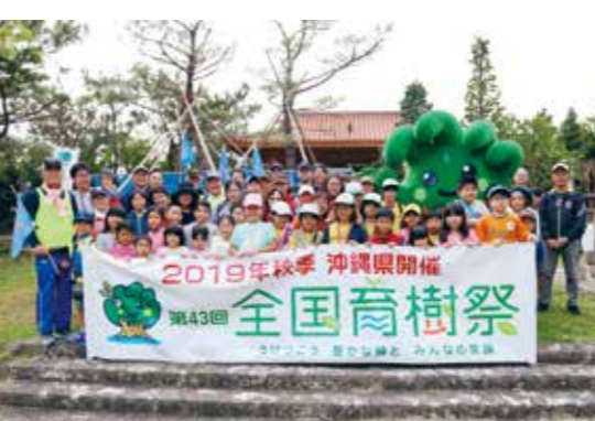
1月13日 プレイベント in 沖縄県平和創造の森公園

全国育樹祭は、皇族殿下の御臨席を仰ぎ、「継続して森を守り育てることの大切さを普及啓発すること」を目的とする全国行事で、昭和52年から都道府県が持ち回りで開催しています。沖縄県では初めての開催であり、2019年12月14日には沖縄県平和創造の森公園においてお手入れ行事が、翌日15日には沖縄コンベンションセンターにおいて式典行事が行われます。なお、その期間中には、様々な併催・記念行事が行われます。