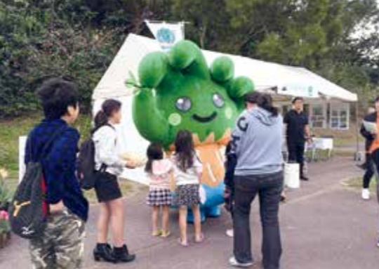
1月19日 もとぶ八重岳桜まつり

知って頂くため、第43回全国育樹祭開催年である2019年には、県内で数多くの記念行事を実施します。 1月には、お手入れ行事会場を活用したプレイベントを実施し、育樹祭に関するクイズを解きながら歩くクイズウォーキングや育樹活動等を多くの方々体験して頂きました。また、2月には、全国育樹祭までの残り日数を知らせる