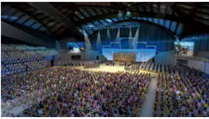
式典行事のイメージ図

全国育樹祭の関連行事の中には、座席の関係上、事前申込みが必要な行事もあります。4月以降には、県内外から約4,000人が参加し、アトラクション、緑の少年団活動発表や緑化等功労者への表彰などを行う全国育樹祭式典行事参加者の募集も予定しています。 また、併催・記念行事についても、準備が整い次第、第43回全国育樹祭公式Webサイトにて、参加者募集や告知等を行う予定です。沖縄で初めて開催される全国育樹祭をお楽しみに！！