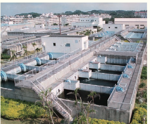
北谷浄水場(現在改良中)