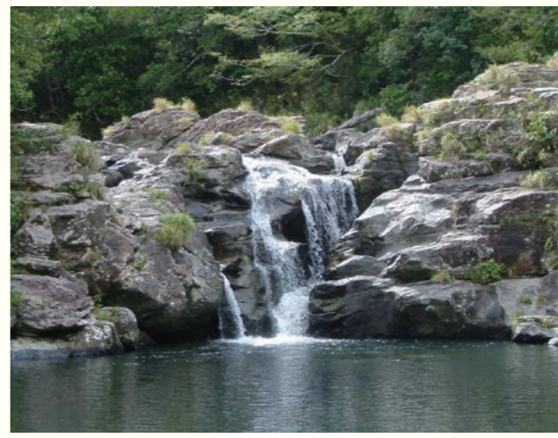
貴重な水源は本島北部に多い

美しい海に囲まれ、豊かな緑広がる沖縄県。私 たちが普段何気なく使っている水道水は、貴重 な水源を大切にしながら、多くの人の努力に よって安心・安全に作られています。では一体、 この水はどのようにして、安全に私たちに提供 されているのでしょうか?身近な存在なのに知っ ているようで意外と知らない、水道について探 ります。