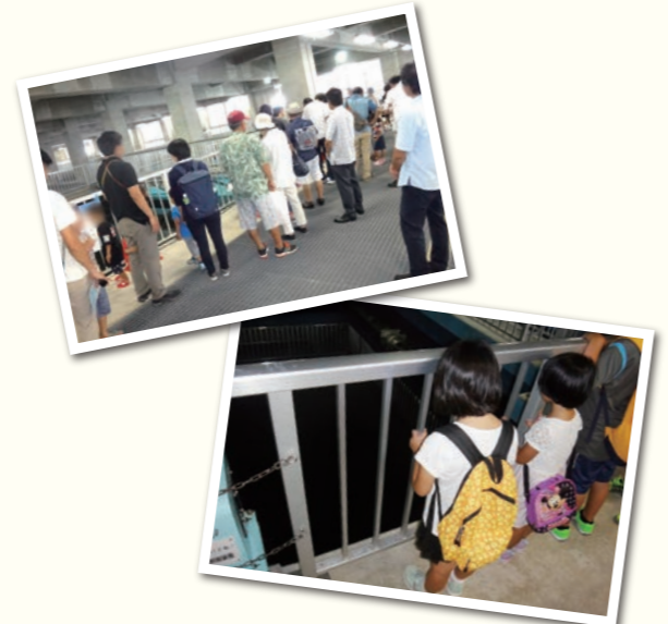
おきなわみずまつりの様子