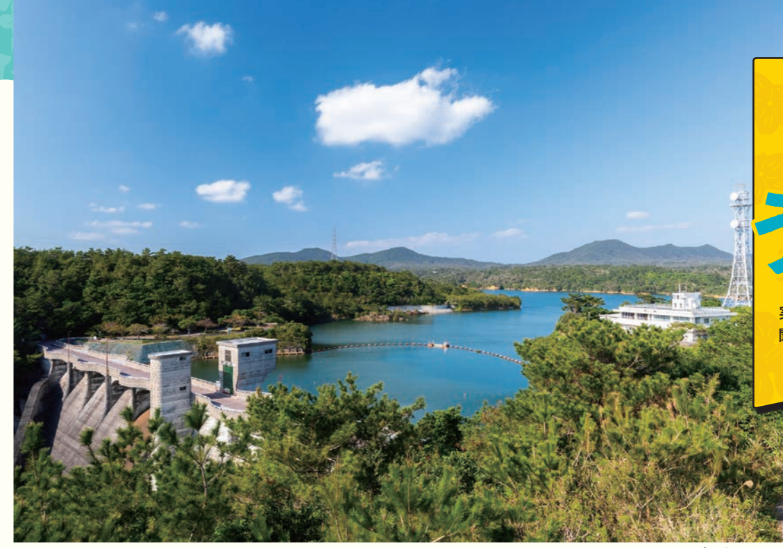
漢那ダム(宜野座村)

平和で豊かな「美ら島おきなわ」の 実現に向けて、その道のスペシャリストに 聞いてみよう!僕らが知っておくべきこと できることをわかりやすく伝えます。