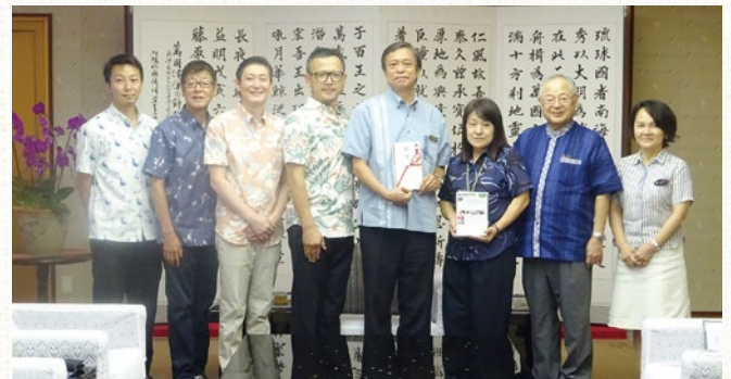
支援者からの無料チケットの贈呈

ネットワークを構築することで、居場所の活動がより一層充実し、継続した取り組みにつながります。県内企業及び県民の皆様の支援の輪が広がるよう、ご支援・ご協力をお願いいたします。