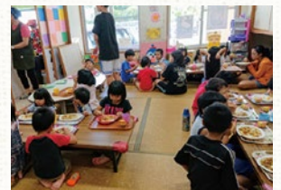
居場所での食事風景

そうした活動を後押しするため、県では、子どもの居場所同士がつながり、運営者が抱える課題等を情報共有するほか、支援者からの支援を速やかに県内の居場所へ届けるため、子どもの居場所ネットワークを立ち上げました。