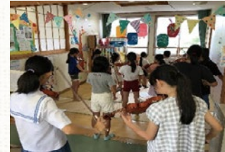
居場所でのイベントの様子

子どもの居場所とは、家庭や学校以外で、放課後や休日に地域の大人や友達と一緒に食事を作って食べたり、勉強したり、創作・体験活動等を行うことができる場所のことです。