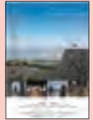
きたなかスケッチ (2018年)

北中城の文化を発信するため、村が初めて製作した映画。村出身の漫画家の主人公が、地元を舞台とした漫画を描こうと村内を取材する中で、人手不足に悩む熱田の伝統芸能「フェーヌシマ」に出会い、村の魅力に気づいていきます。