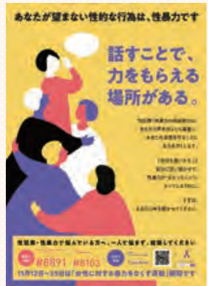
内閣府「性暴力をなくそう」令和4年度ポスター