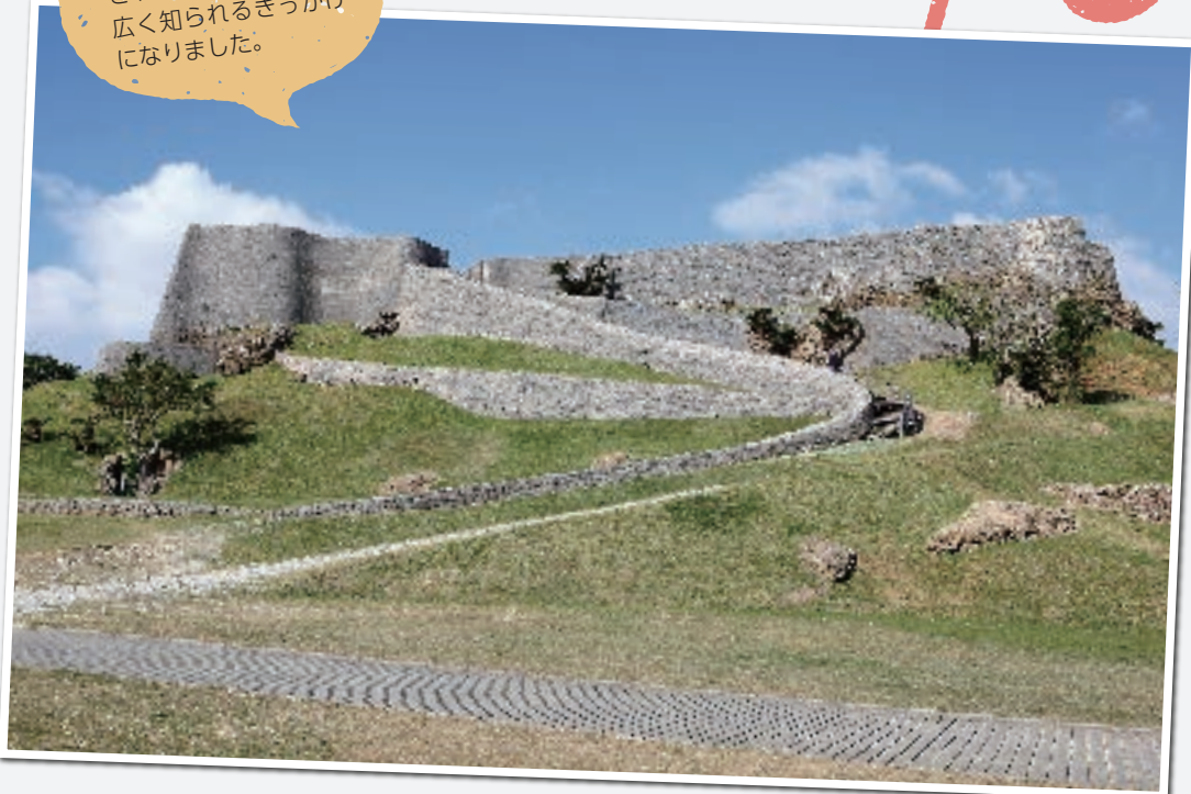
世界遺産に登録された勝連城跡