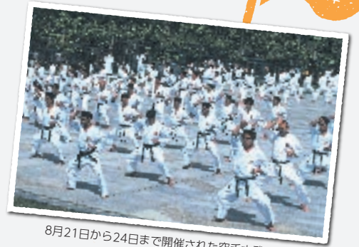
8月21日から24日まで開催された空手古武道世界大会

「沖縄の空手・古武術」が県の無形文化財に指定され、完成したばかりの県立武道館で、沖縄空手古武道世界大会を開催。4日間で50カ国から約1700人が参加し、交流を深めました。