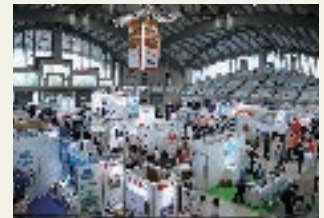
ResorTech EXPO 2021 in Okinawaの様子