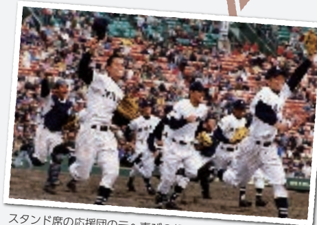
スタンド席の応援団の元へ喜びの報告に駆け出す選手