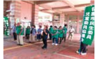
民生委員の日 PR 活動(名護市役所)