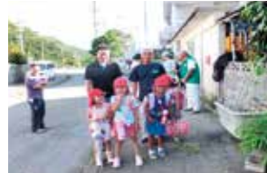
朝のあいさつ運動