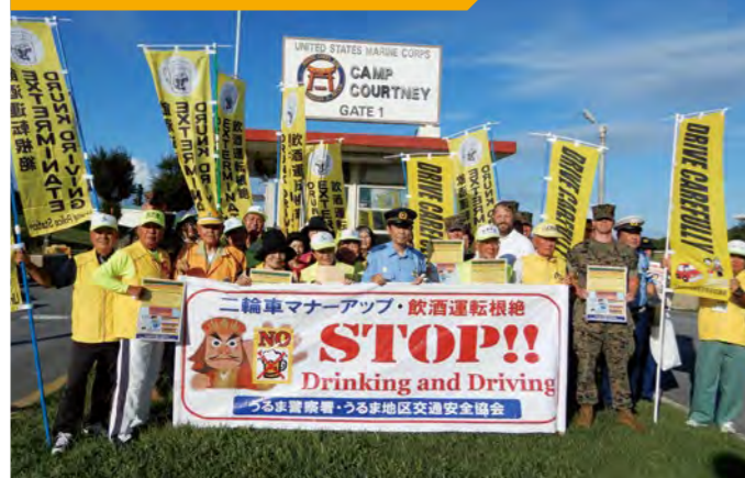
飲酒運転根絶運動