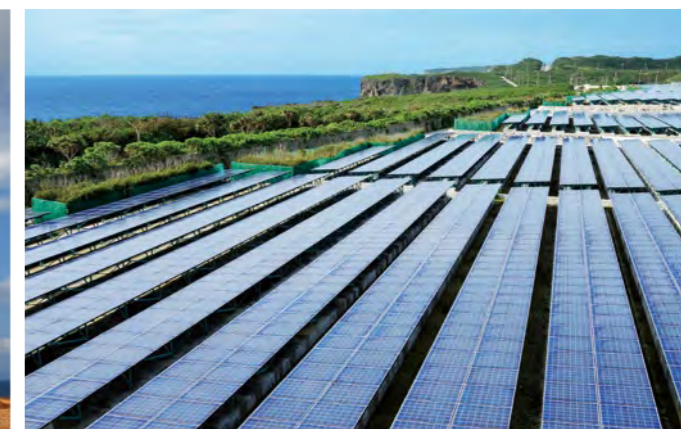
自然のエネルギーを利用した太陽光発電設備