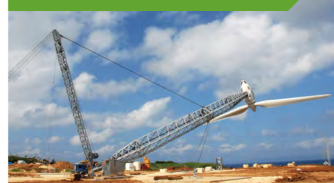
台風時には傾倒できる可倒式風力発電