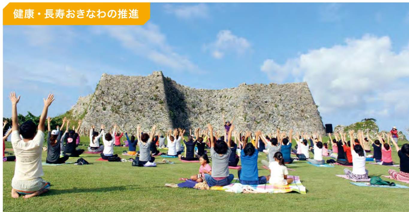
自然の中でリラックスして行う「城ヨガ」