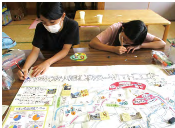
地域の安全について学ぶ取組