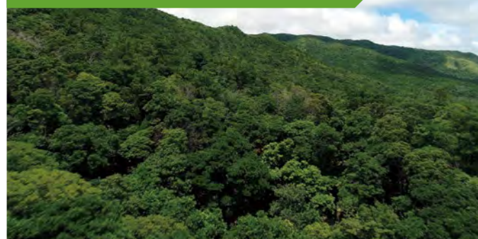
多種多様な動植物が生息・生育する、やんばる国立公園