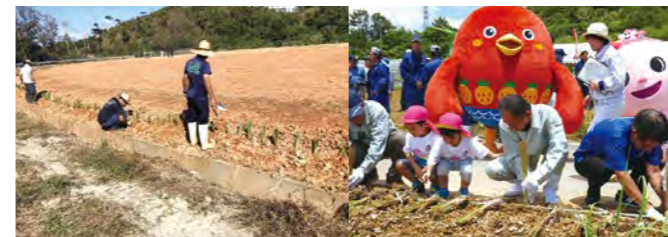
グリーンベルト(植生帯) 植栽の様子