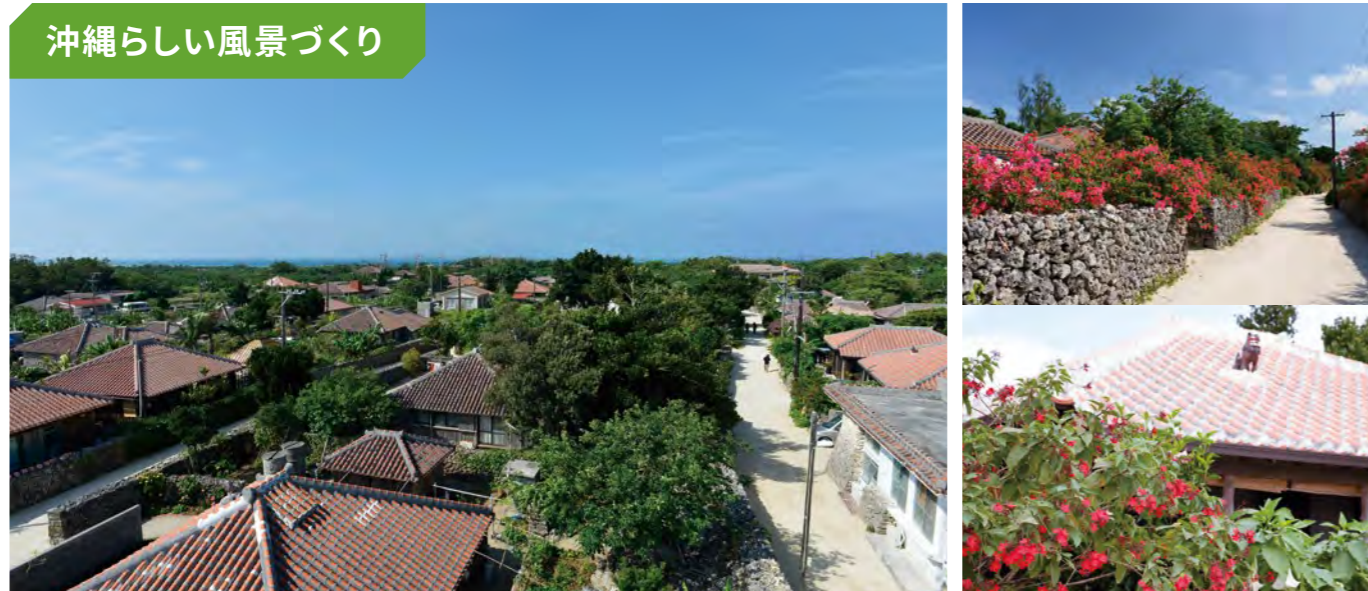
沖縄の原風景が残る竹富島の集落