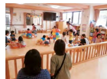
保育所見学ツアーの様子