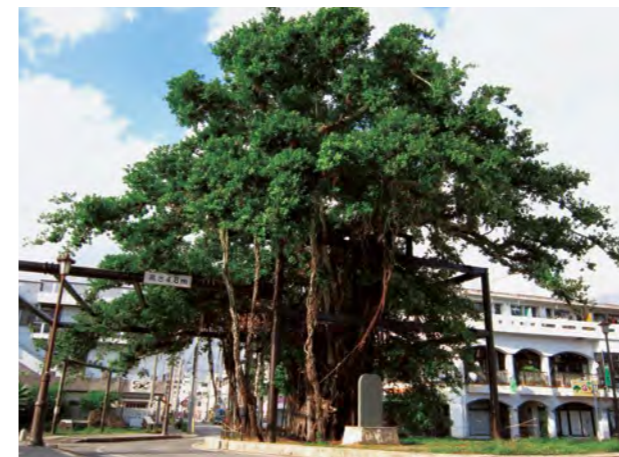
推定樹齢300年のヒンプンガジュマル