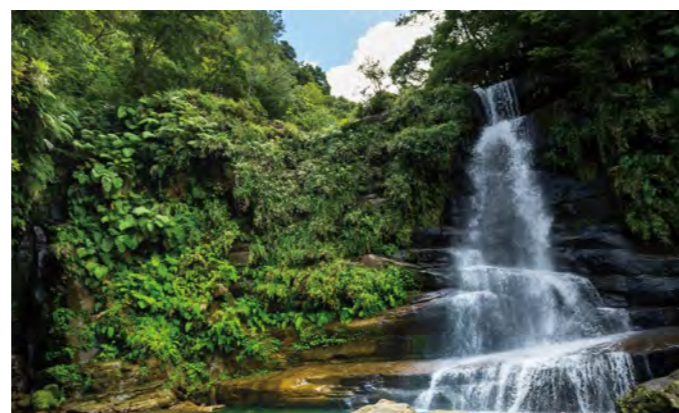
西表島にあるナーラの滝

《沖縄県指定希少野生動植物種》 希少野生動植物種のうち、特に保護を図る必要があるものを指定して守っています。