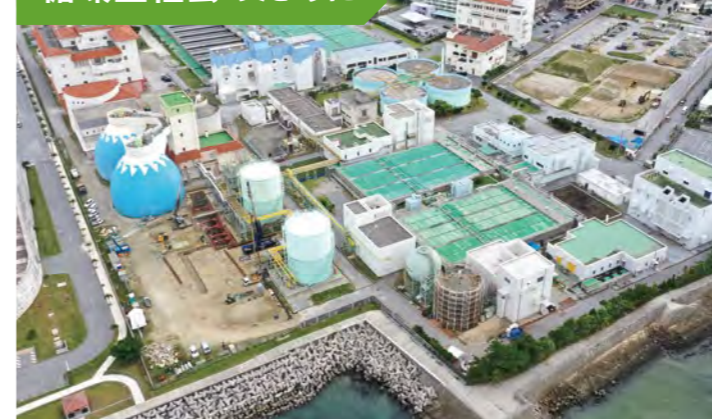
汚水を浄化する那覇浄化センター