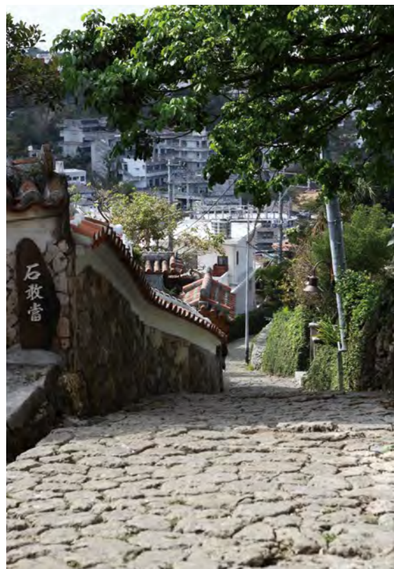
首里城から続く風情ある道、金城町石畳

沖縄の景観特性は、豊かな自然や独自の歴史が育む「自然・歴史」、赤瓦の民家が残る集落に代表される「地域の特性」、伝統行事や生活景として「人と暮らし」、大規模開発や道路、海岸といった「公共空間等」などがあります。長年の取り組みにより守り、つくられてきた多様性のある景観・風景を次世代へとつなぐため、沖縄県では地域ごとの個性を生かした価値創造型のまちづくりを進めています。