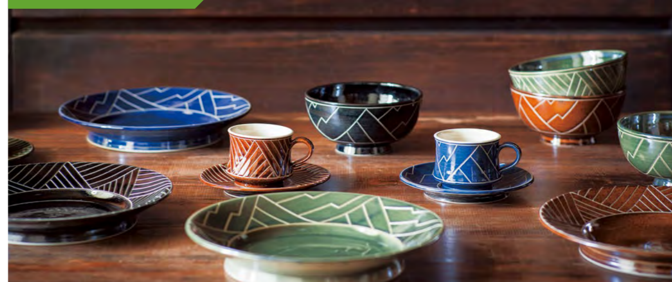
現代風にアレンジした焼き物「やちむん」