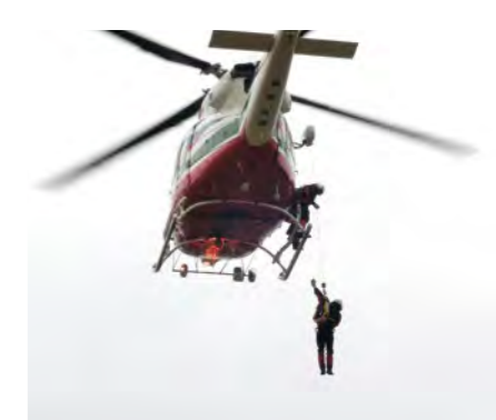
消防ヘリを使った訓練