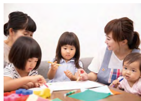
多様化する保育ニーズに対応