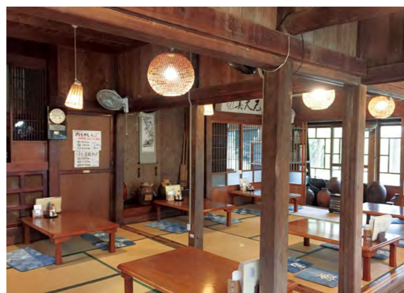
沖縄の古民家を利用した飲食店やエステサロン