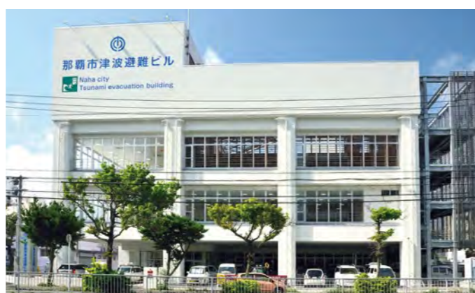
那覇市津波避難ビル