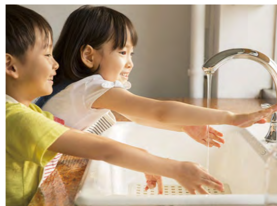
幼児期から手洗い習慣を身につける