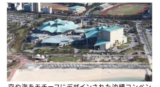
空や海をモチーフにデザインされた沖縄コンベンションセンター