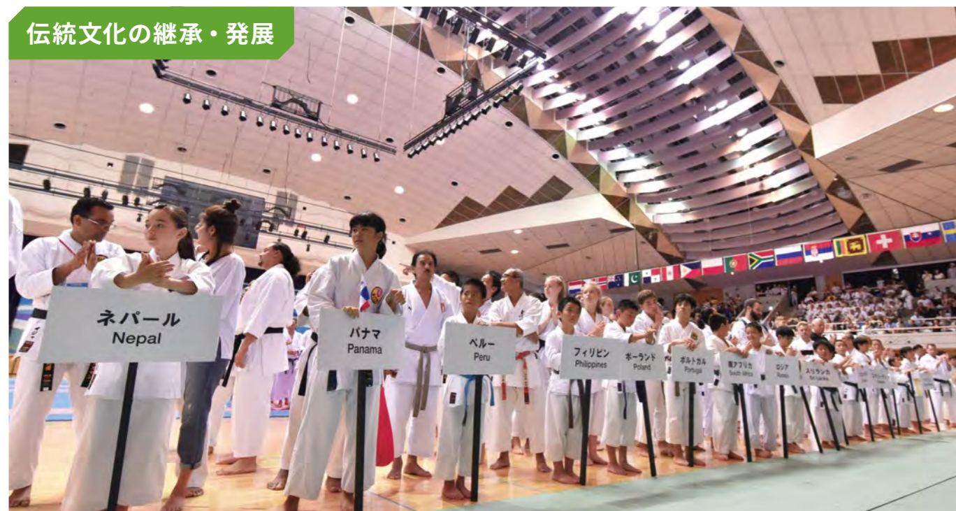
沖縄県で開催した国際空手大会