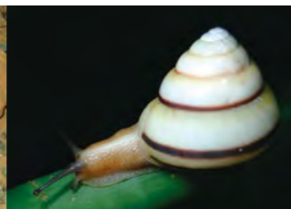
オキナワヤマタカマイマイ