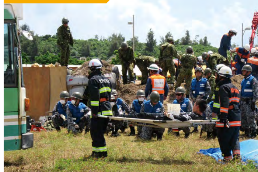
災害を想定した防災訓練