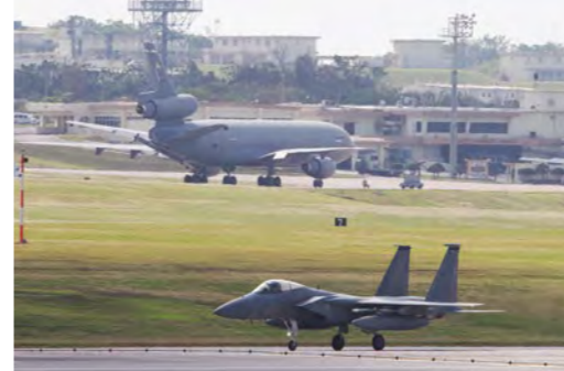
騒音や環境汚染への対応