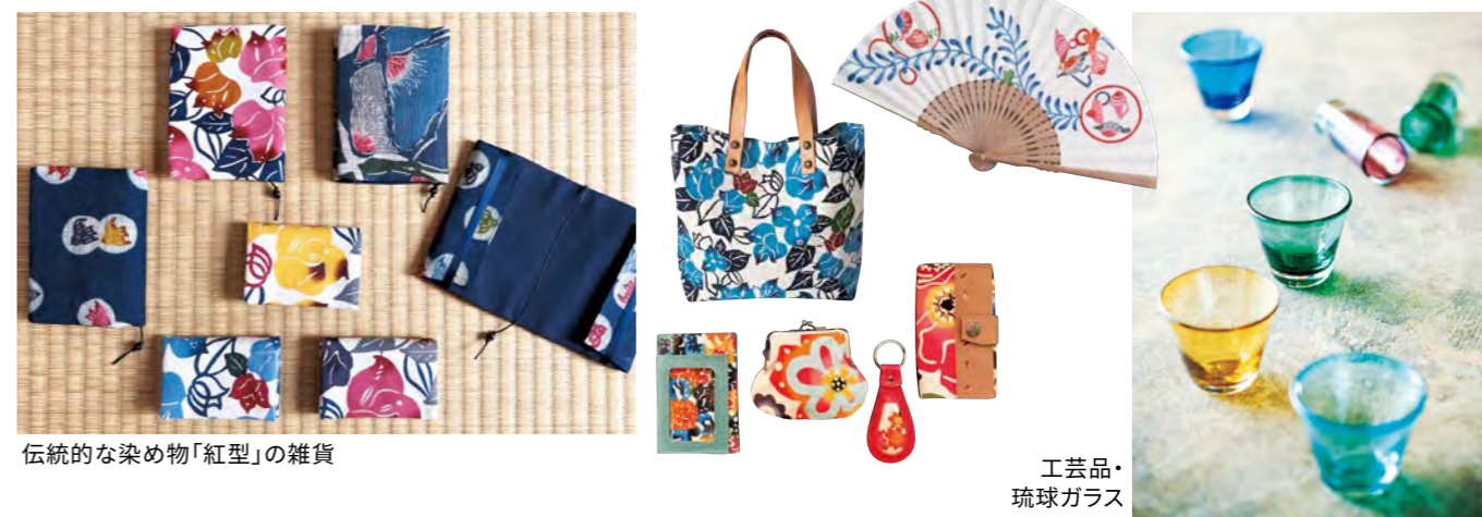
伝統的な染め物「紅型」の雑貨