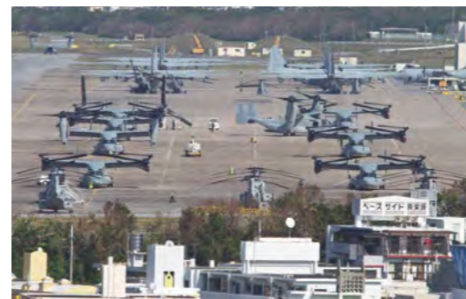
住宅地の中に基地があるため安全性が求められる