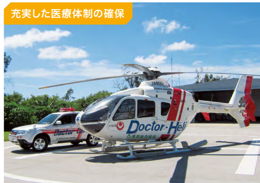
離島・へき地で活躍する救急医療用ヘリコプター