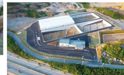
産業廃棄物管理型 最終処分場 安和エコパーク