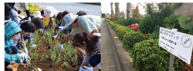
ボランティアによる苗木の植樹作業