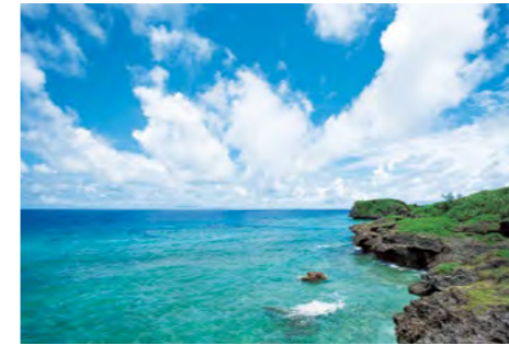
琉球石灰岩からなる絶壁・万座毛