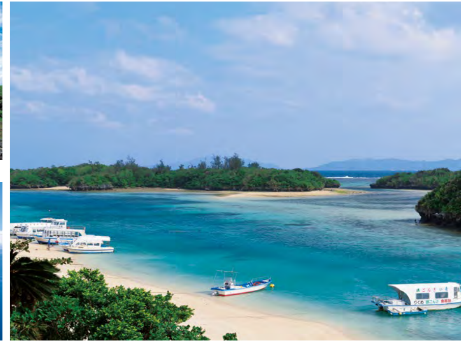
透明度を誇る海が自慢の石垣島・川平湾