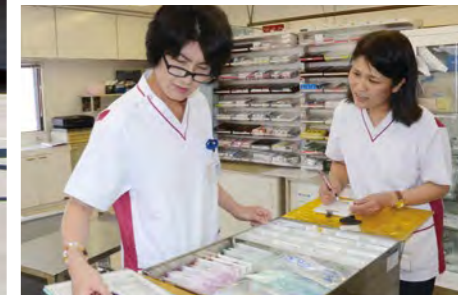
地域医療を支える看護師