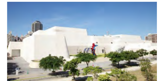
沖縄のグスク(城)をイメージした造りの沖縄県立博物館・美術館