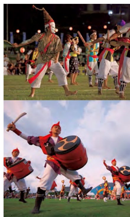
伝統芸能・エイサー