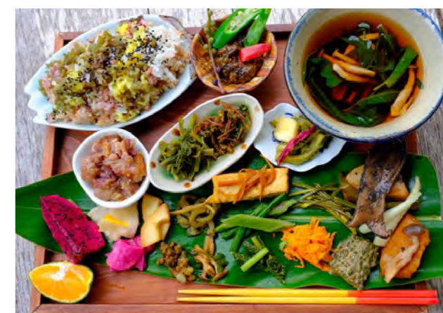
地元食材を使った沖縄菜膳料理