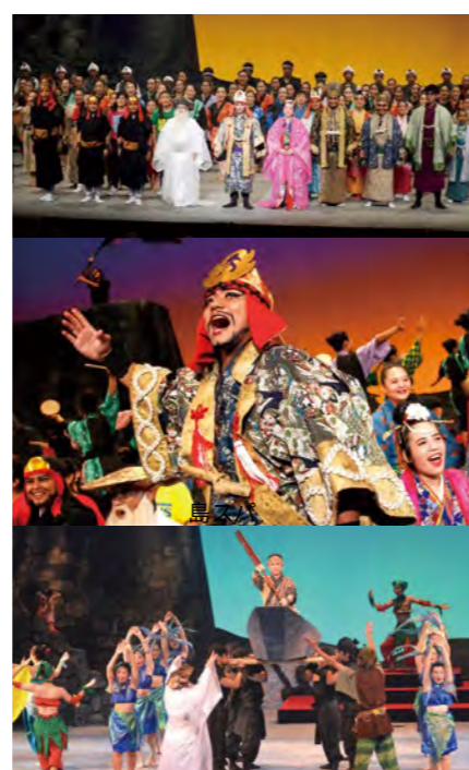
うるま市の中高生による現代版組踊「肝高の阿麻和利」