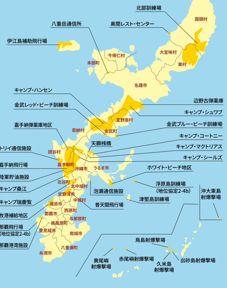
日本における米軍専用施設面積のうち約70.3%が沖縄に集中