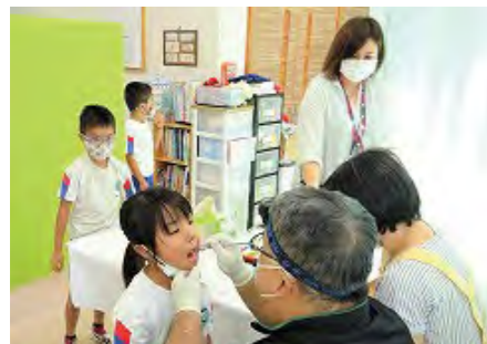
虫歯予防を心がける