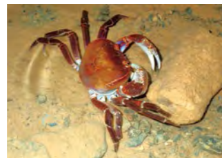
オキナワオオサワガニ

《沖縄県指定希少野生動植物種》 希少野生動植物種のうち、特に保護を図る必要があるものを指定して守っています。