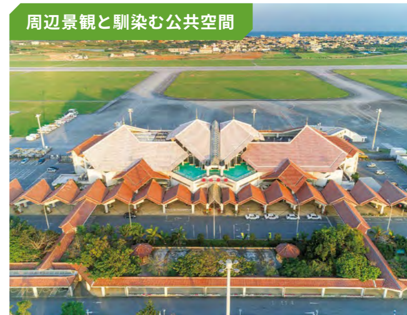
市鳥サンバがモチーフの宮古空港ターミナルビル