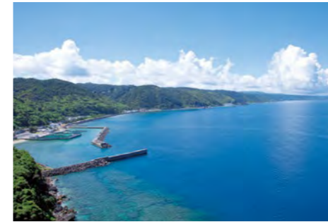
断崖絶壁から見渡す絶景・茅打ちバンタ