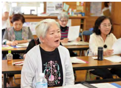
高齢者が生き生きと暮らせるようサポート