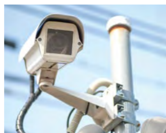
防犯カメラの設置