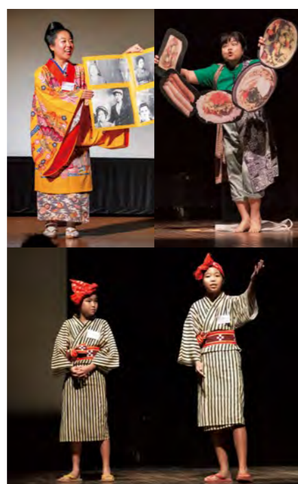
県内各地域の言葉「しまくとぅば」を学び、披露する子どもたち