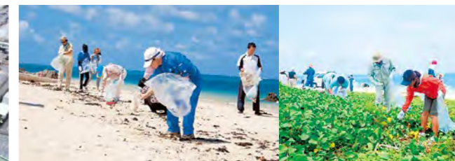
漂着ごみを拾う海岸清掃