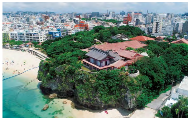
青い海を見下ろす高台にある波上宮