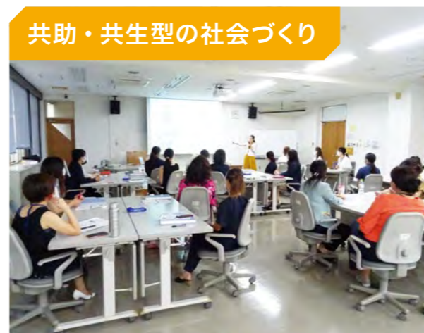
女性育成人材講座「ているる塾」