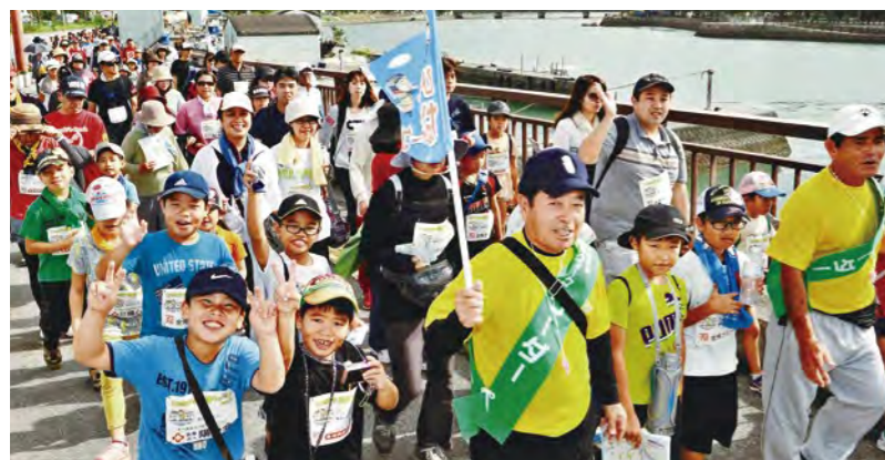
積極的に体を動かし、健康を維持する

次世代を担う子どもたちが健やかに生まれ育ち、適切なサービスや支援が受けられるよう、保健や医療、福祉の提供体制を整えます。また、県民一人ひとりが主体的に日々の健康づくりに取り組むとともに、高齢者や障がいを持つ人たちの社会参加を支援し、社会的包摂(ソーシャルインクルージョン)を支える環境づくりを推進します。