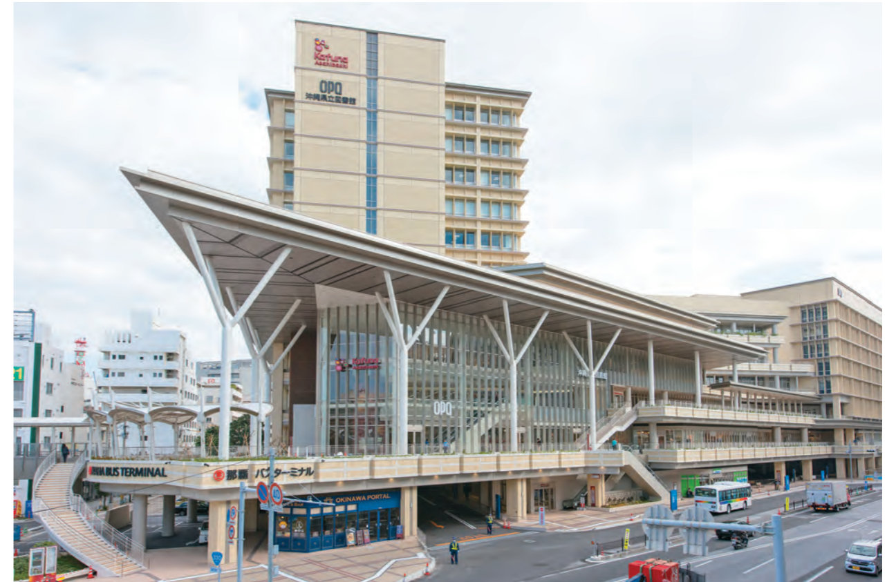
「コーナ旭橋」の3~6階に移転新築した沖縄県立図書館