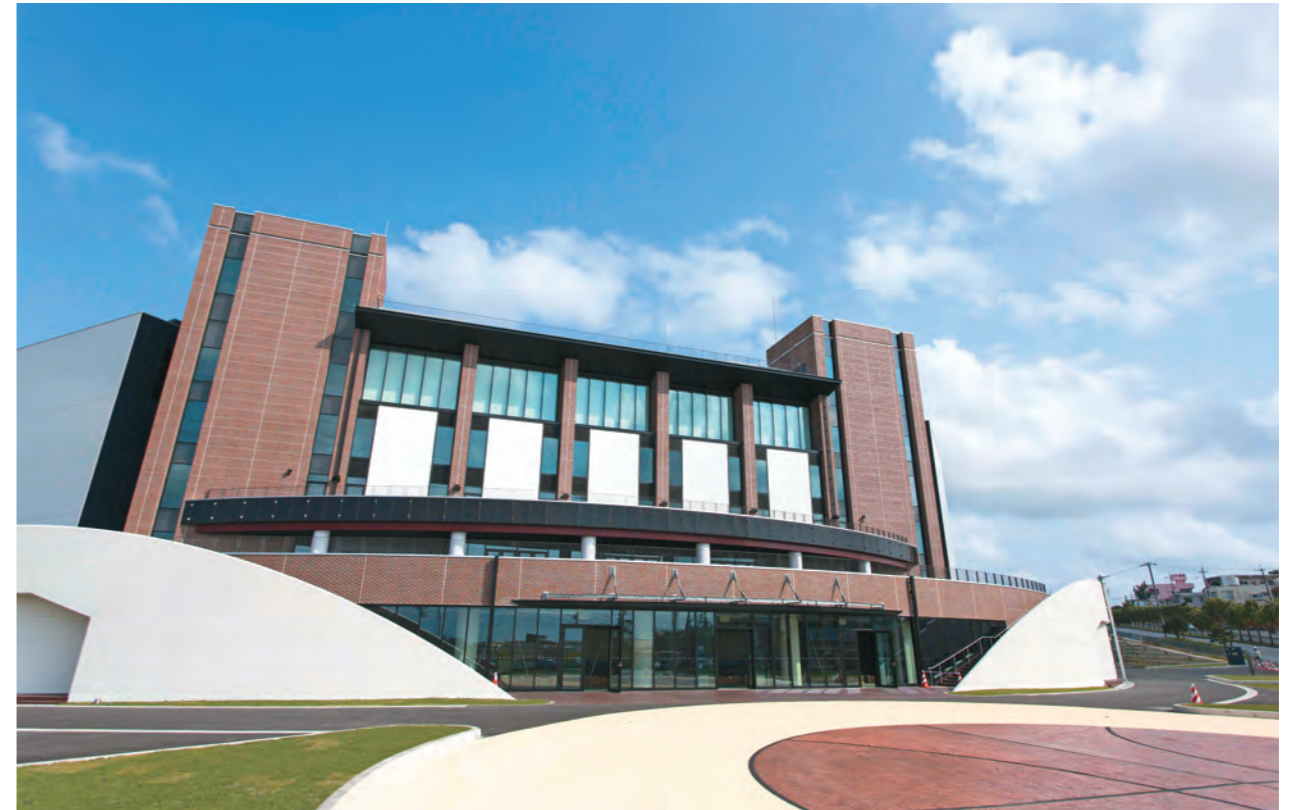
屋内施設としては県内最大の収容人数を誇る沖縄アリーナ