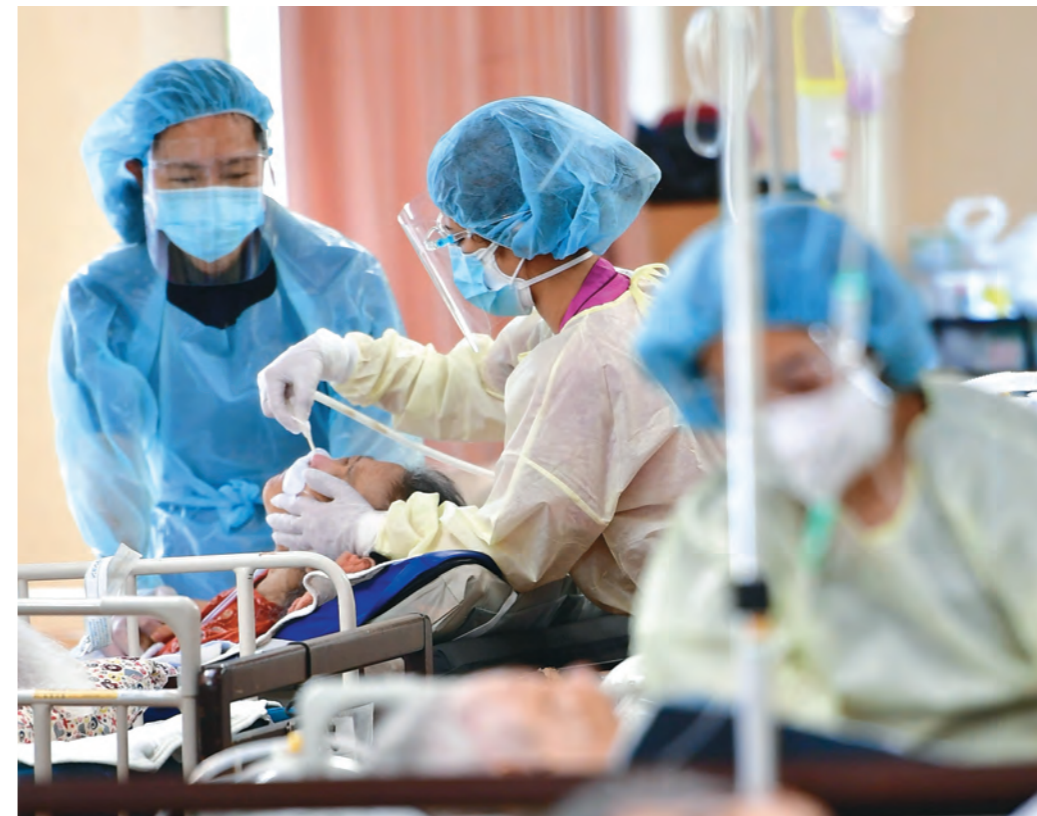
次々と搬送されてくる患者の対応に追われる医療施設