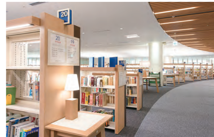
フロアごとに書架の配置や閲覧席も異なります。