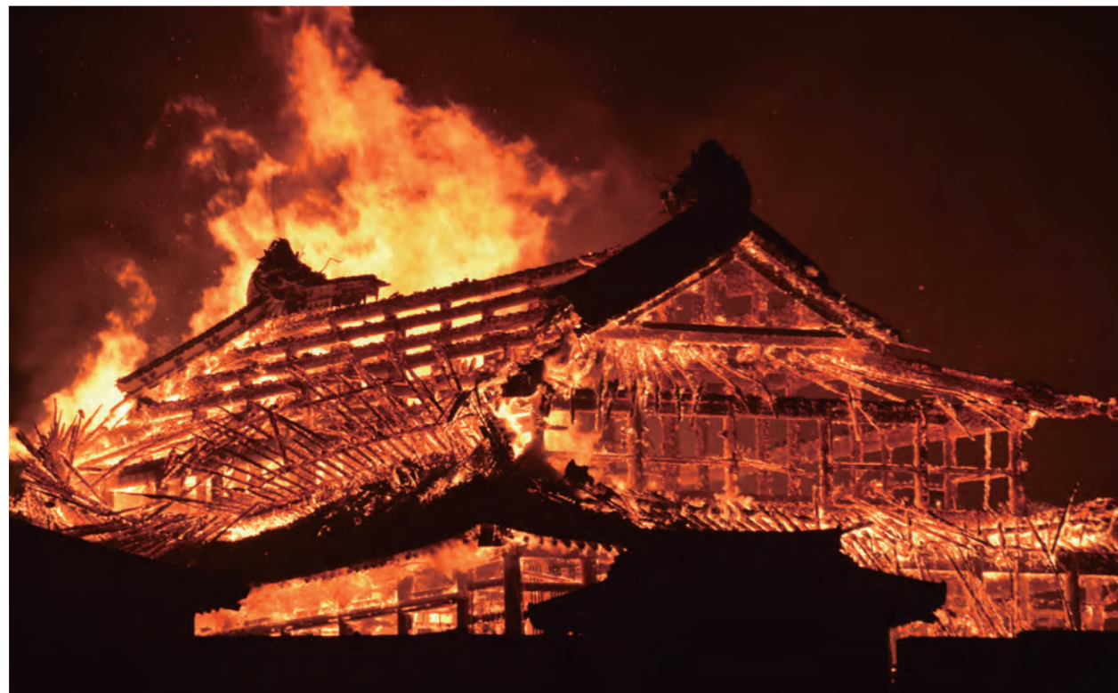
10月31日午前4時25分ごろの首里城正殿