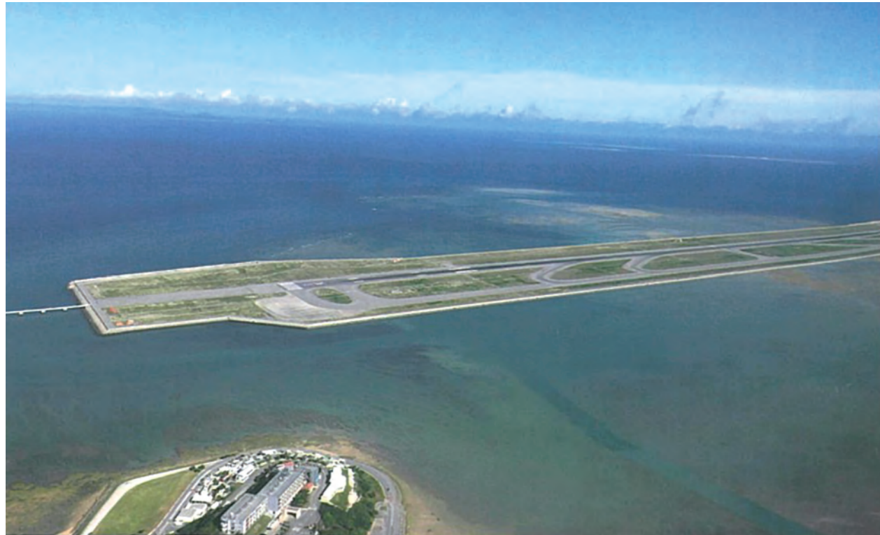
さらなる利用客の増加や貨物取扱量の増大にも対応する第2滑走路