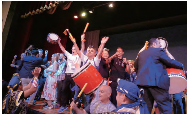
最終日に開かれた 交流会のフィナーレ