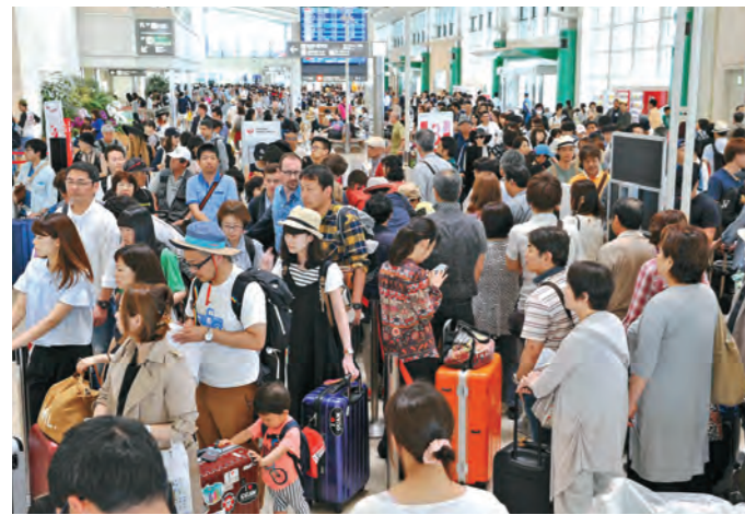
多くの家族連れなどで ごった返す那覇空港