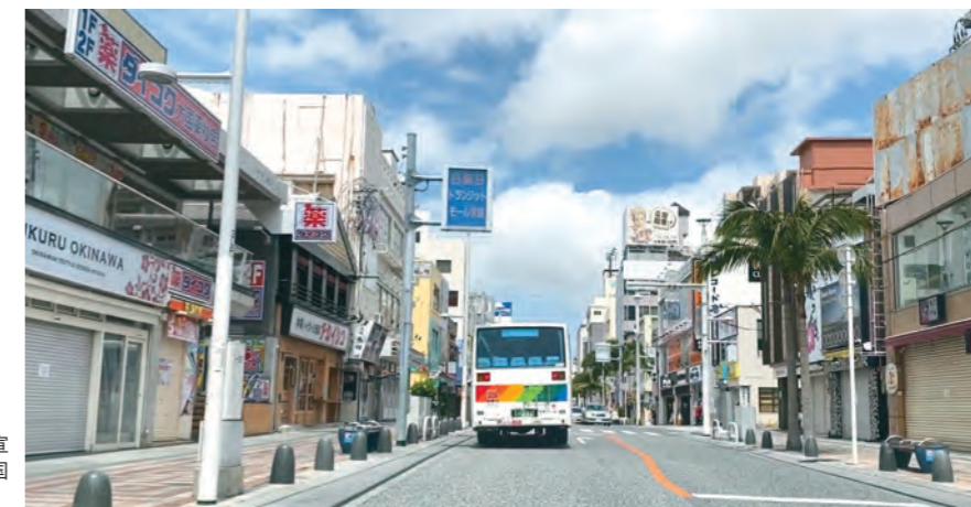
県独自の緊急事態宣言下で閑散とした国際通り=2020年5月