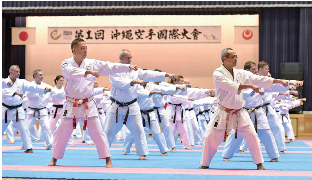
世界50の国や地域から延べ約3500人が参加しました。写真は初日の演武交流会。