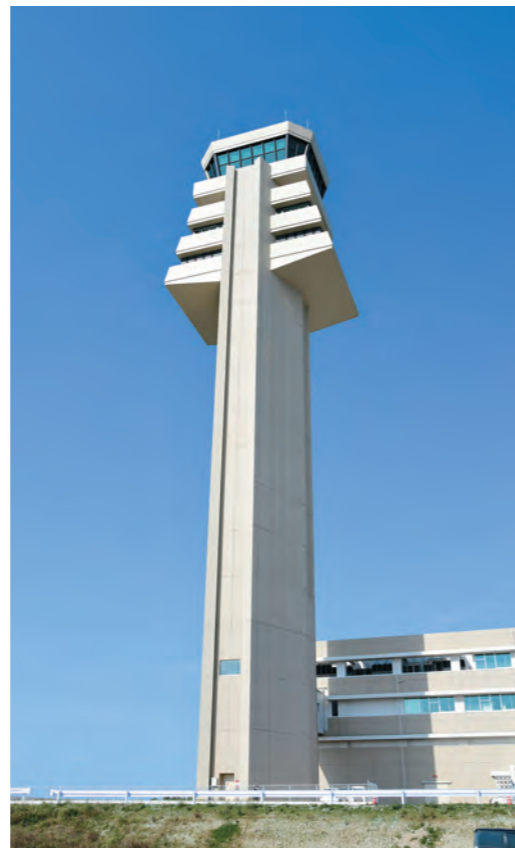
地上88メートルの高さの新管制塔