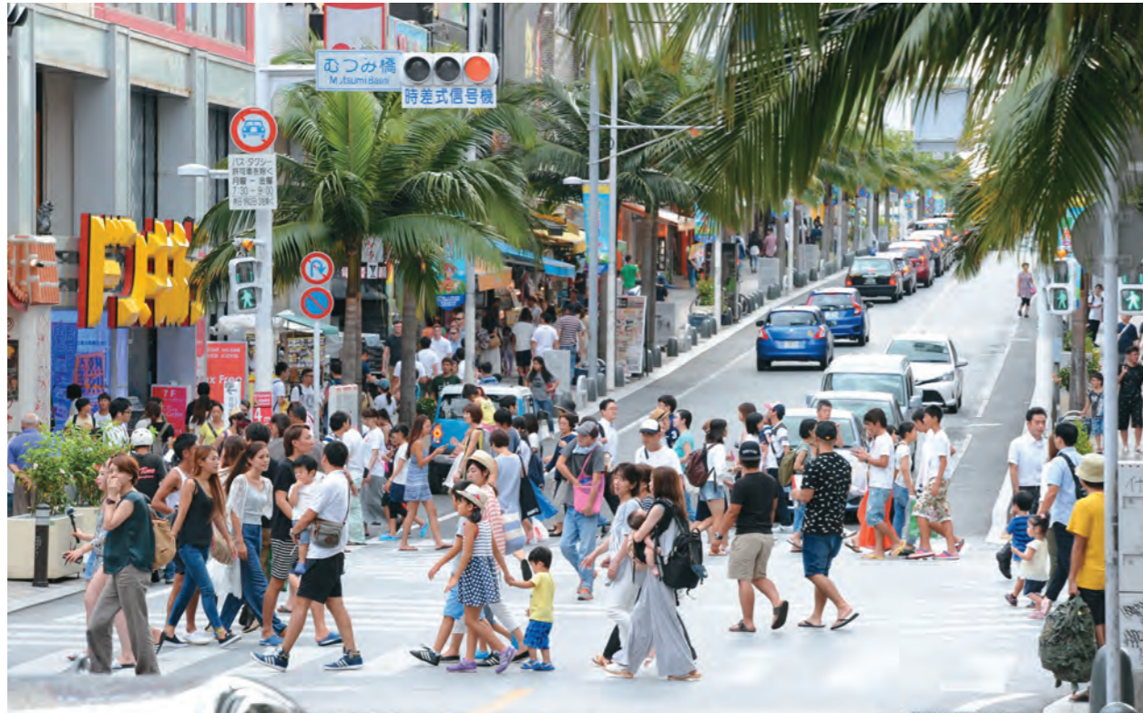
観光客でにぎわう国際通り