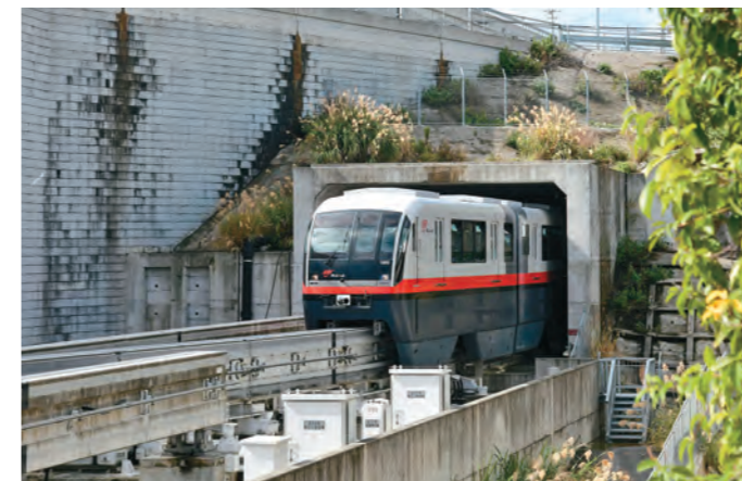
モノレールでは珍しいトンネル区間