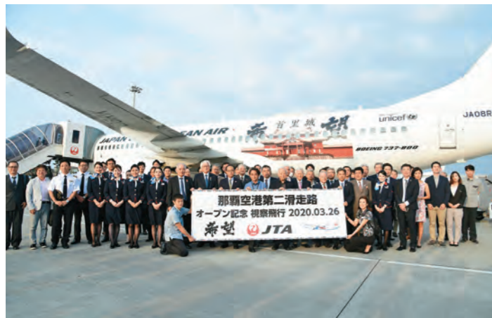
供用開始を記念した視察飛行