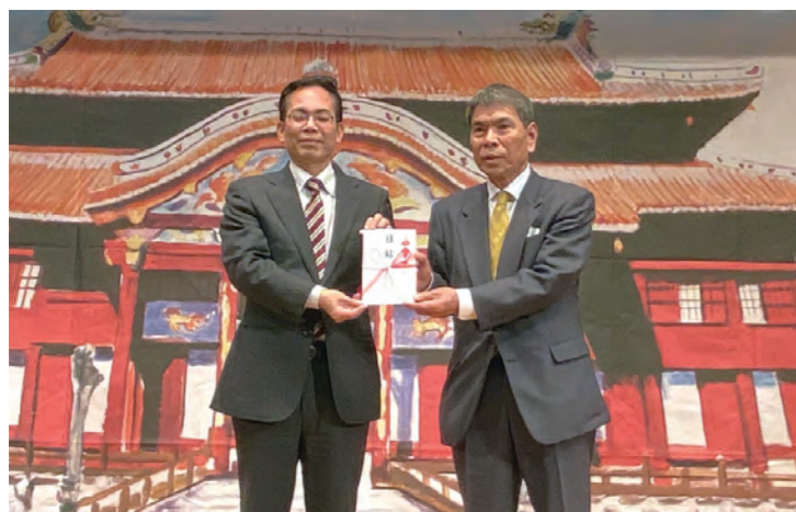
焼失直後から、県内外から多くの寄付金が寄せられました(写真は沖縄県人会兵庫県本部)。