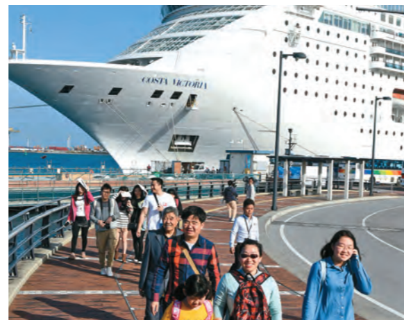
クルーズ船を下船する 外国人観光客