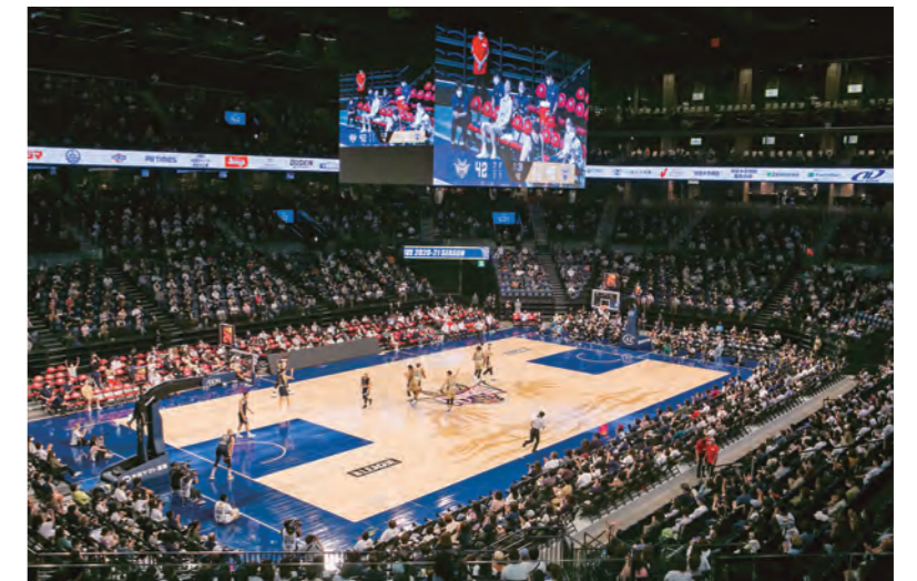
プレオープンイベントの琉球ゴールデンキングスホームゲーム