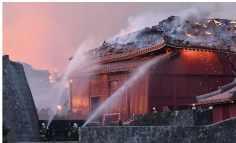
31日午前6時25分ごろ、必死に消火活動を行う消防隊員。