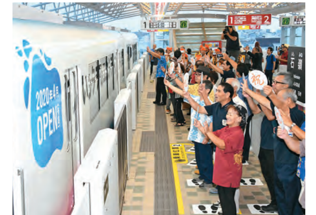
石嶺駅で乗車客を見送る関係者