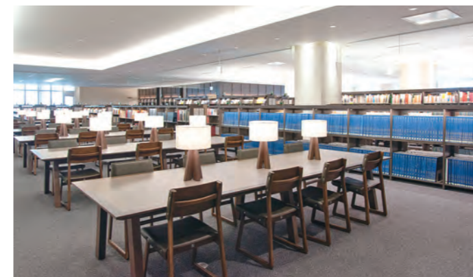
落ち着いた雰囲気の郷土資料室