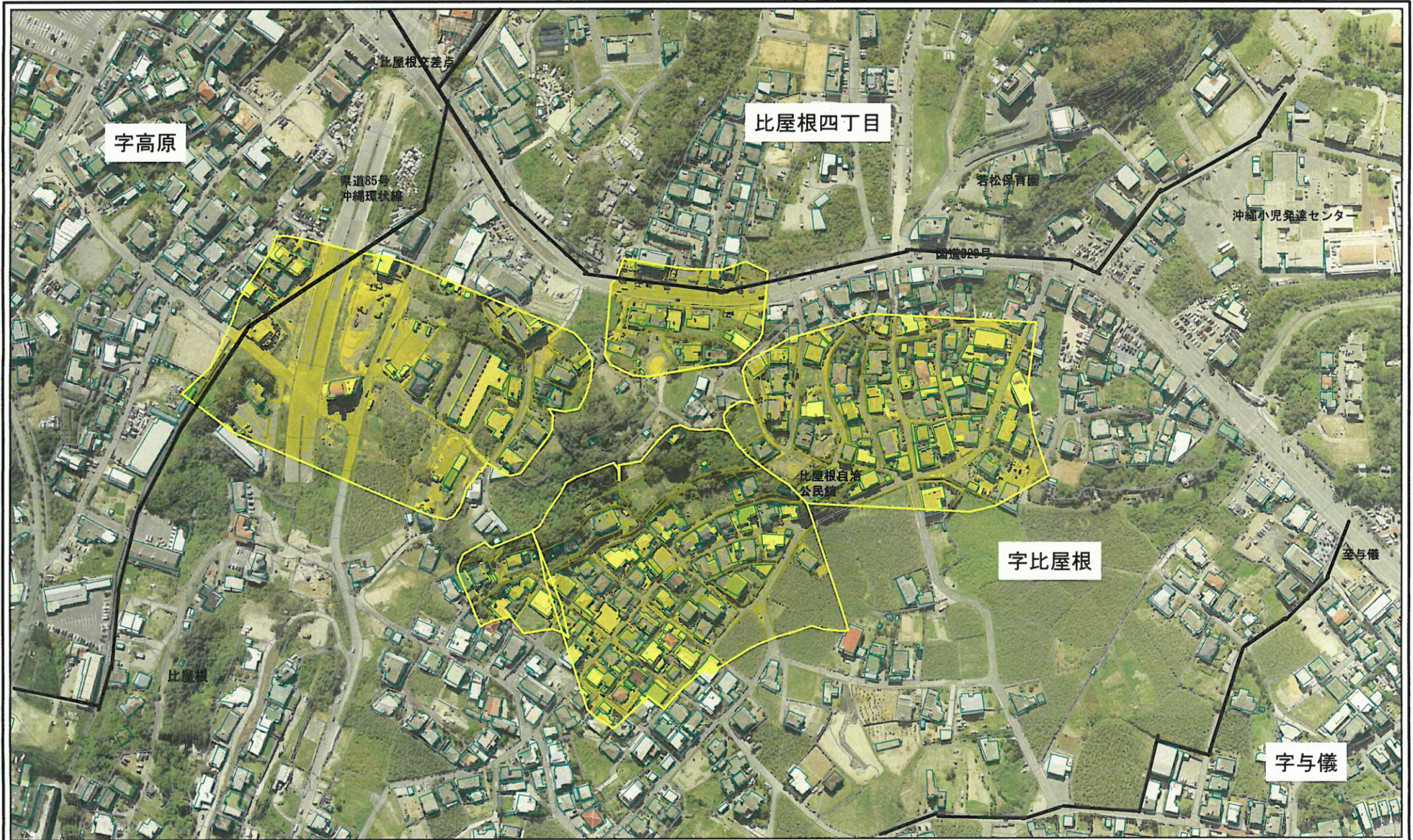
様式-2-1(地) 土砂災害警戒区域 区域図(その2)