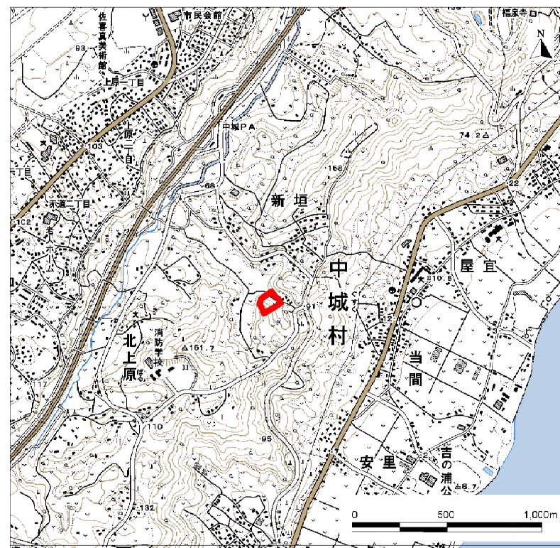
( 1/25,000 )