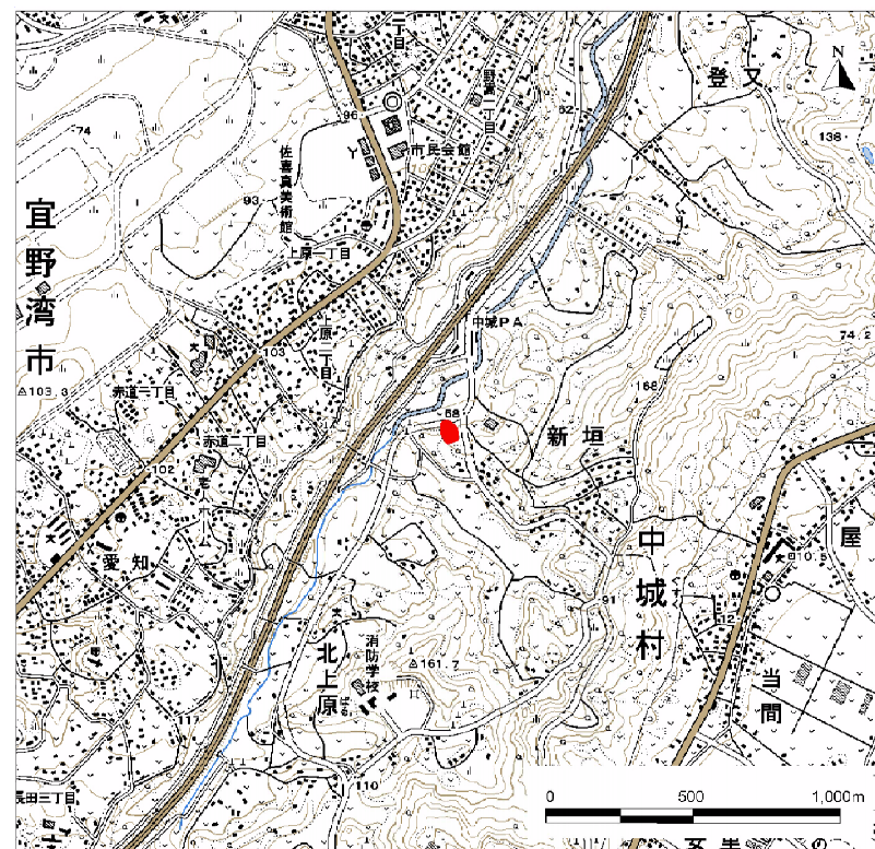
( 1/25,000 )