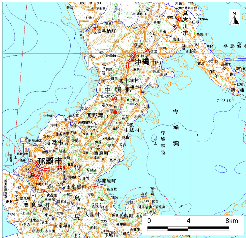
( 1/200,000 )